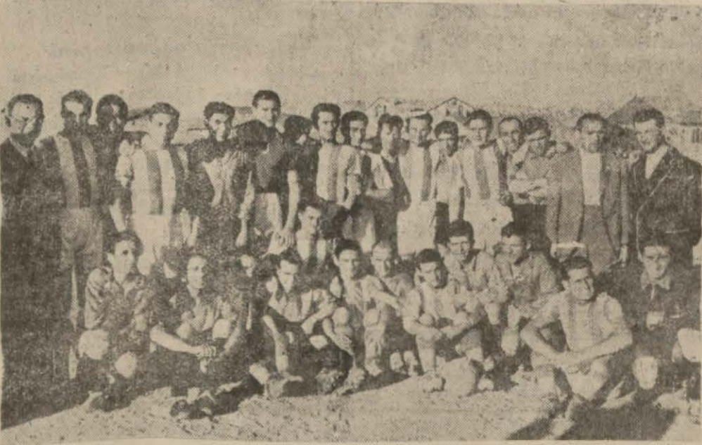
Gençler Birliği ve Uypeşt takımları bir arada

2 inci bölümde gene oyuna giren K. Ali daha birinci dakikada İhsan (Sonu 5. inci sayfada)