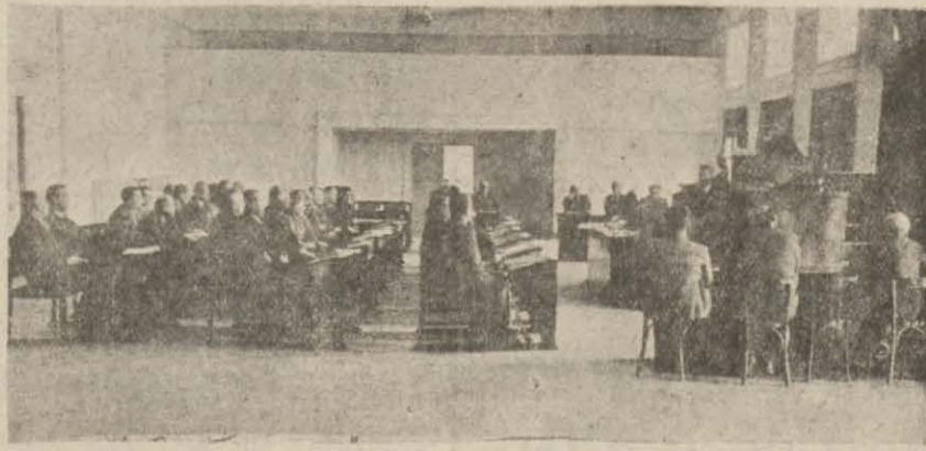
Geçen seneki Umumi Meclis toplantısından bir görünüş

Vilâyet Umumî Meclisi bugün saat 14 de mali yılı bütçe çalışmalarına başlayacaktır.