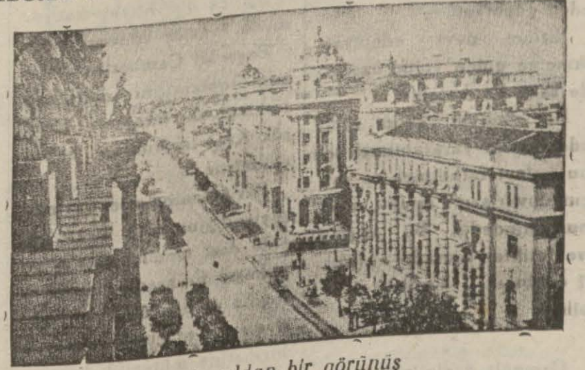
Belgradtan bir görünüş

Yugoslavyanın, sulhu için çok kuvvetli bir mesned olan Balkan Antantına sadakatı baki