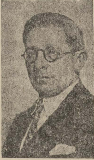
Maliye Vekili Fuat Ağralı

Maliye Vekili izahatları arasında sanayi işlerimizin inkişaf ve yurdun imar ve