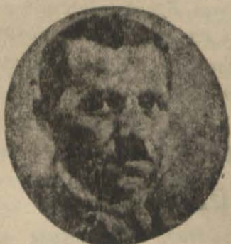
B. Şakrî Saraçoğlu Büyük elçi istasyonda Hariciye Vekâleti husulî kalem müdür muavini, Fransız sefaret koloneli erkânı tarafından karşılanmıştır. Hariciye Vekilimiz Şakrî