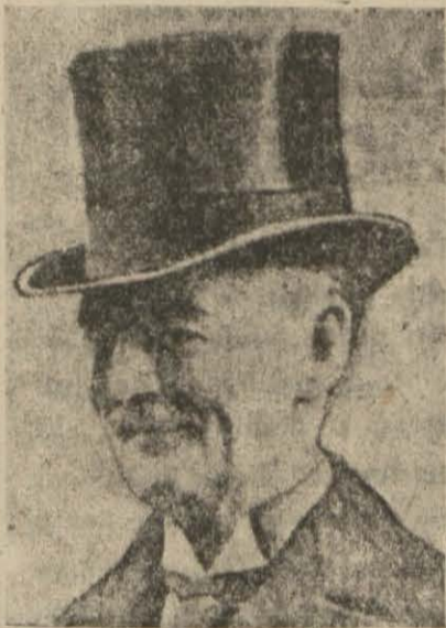
B. Çemberlâyna Paris, 10 (Radyo) — Gazeteler, İngiliz nazırlarının Roma seyahatinden bahisle uzun makaleler yazıyorlar.

Saraçoğlu yeni Fransız büyük elçisini öğleden sonra Hariciye Vekâletinde kabul etmiştir.