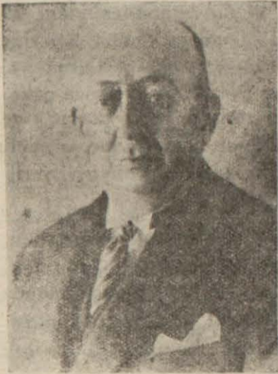
Başvekilimiz Dr. Refik Saydam tezin riyasetinde toplanmış tır.