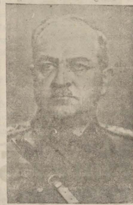
Korgeneral Sabit Noyon

İki yıldan fazla bir zamandanberi şehrimizde bulunan Korgeneral Sabit Noyon bu defa Ankaraya diğer bir vazife ile tayin edilmiştir.