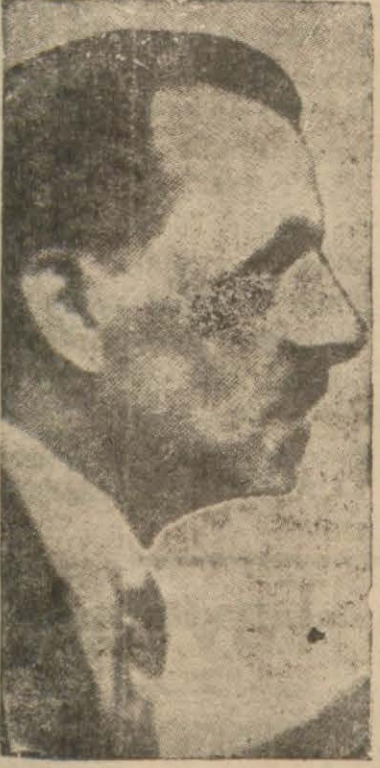
B. Şükrü Saraçoğlu Ankara, 12 (A.A.) — Cumhuriyet Halk Partisi Kamutay

Hariciye Vekili vekili B. Şükrü Saraçoğlu konuşmalar hakkında Parti gurubunda izahat verdi..