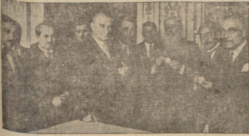
Ulu Önder Atatürk Dil Kurultayına İştirak Eden Âtlmler Arasında..

Bugünkü bayram; bu inanımızdan kopup gelen sonsuz sevinci en güzel şekilde açıklamaktadır