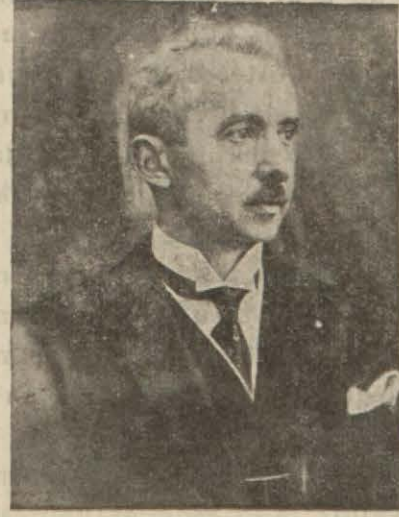
GENERAL İSMET İNÖNÜ

Cumhurreisi Atatürk, Celâl Bayarın Başvekâlet vekâletini deruhte etmelerini tasvip ettiler