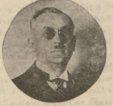
B. CELAL BAYAR

İstanbul, 20 [Hususi Mu- haberimizden] — Malatya mebusu ve Başvekil Gene- ral İsmet İnönüye istirahat etmeleri için bir buçuk ay