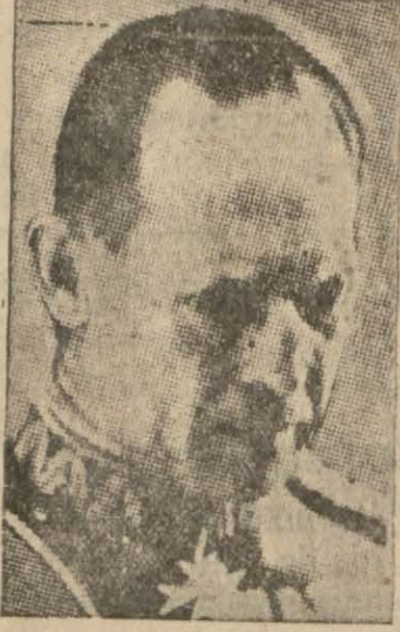
Yunan Kralı Jorj Be'grad, 23 (Radyo) —

Politika gazetesinin Atina'dan öğrendiğine göre Yunan Kralı Jorj. General Metaksasın Ankaradan avdetini müteakip Roma, Paris ve Londra'yı ziyaret edecektir. Atina, 23 (A.A.) — Yunan gazeteleri Kral Jorjun bu ay sonlarında Parise ve Londra'ya gideceğini yazmaktadırlar.