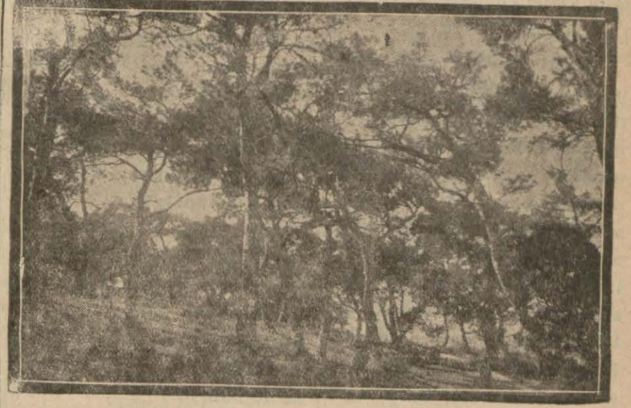
Vilâyetimiz Çevresindeki Zeytinliklerden Biri

Memleketimizde 26 milyon zeytin ağacı, buna mukabil 54 milyon yabanî zeytin vardır.