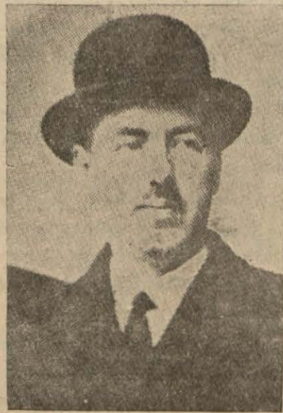
B. Von Zelând

Paris, 23 (Radyo) — Belçika Başbakanı B. Von Zelând; milli bankada görülen yeni suiistimal münasebetile mezuniyetten avdet eder etmez İstifa edeceği söyleniyor.