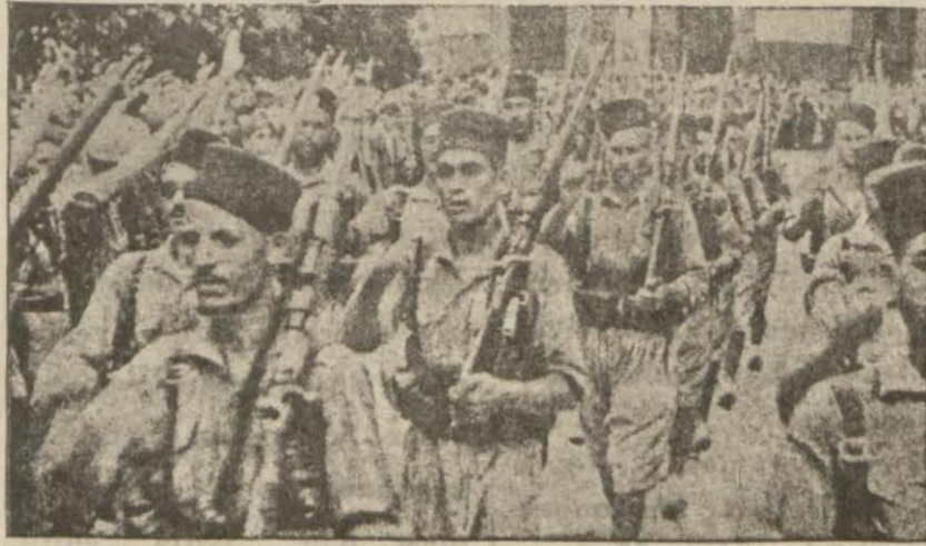
GENERAL FRANKONUN FASLI ASKERLERİ

Şark cephesinde üç gün devam eden muharebe neticesinde bir kaç mühim mevki ele geçirilmiştir. Dün askerlerin bu mevkiyi istirdad için yaptığı taarruz şiddetli bir mukavemetle püs kurtulmuştur.