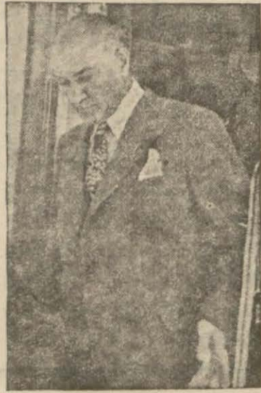
lehlere çevirmek için ça- lışmaktadırlar. Bu şiddetli

muharebelerin bugün akşa- ma doğru aldığı vaziyet kırmızı tarafın faik bulunduğu merkezindedir.