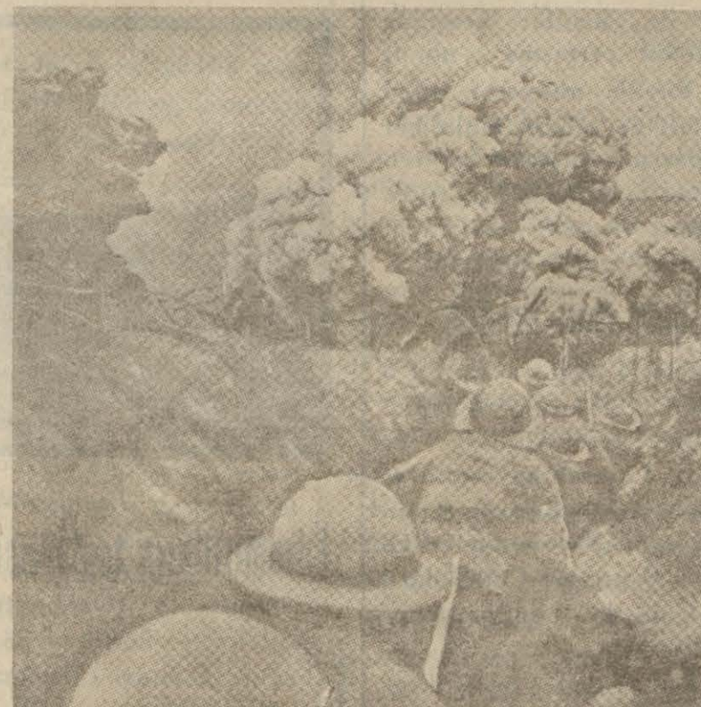
Son İtalyan - Habeş muharebesinde şiddetli top ateşi ve bombardıman

Habeşlerle İtalyanlar arasında önemli bir çarpışma oldu. Bu çarpışmada Habeşler (50) ölü ve yaralı, İtalyanlarda (14) ölü ve (40) yaralı verdiler.