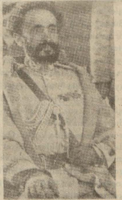
İmparator Haile Selassie

Adisababa, 22 (A.A.) — İmparator yakında Dessiye gidecektir. Harbin İmpara- torun cepheye gitmedik- çe başlayacağına pek az ih- timal verilmektedir.