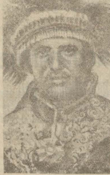
Habeş ordusu Kamutanları- ndan Ras Seyyum Londra, 22 (A.A.) — İt.

Habeşliler Adigrat, Adua, Aksum Hattındaki Mevkileri Tahkim Ediyorlar.