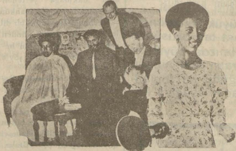
İmparator ve ailesi (İmparatorçe sağda)

Adisababa, 22 (A.A.) — Bugün İmparatorun muhafız kitaatının yüzde altmışı Des- siedeki muvakkat genel ka- rargâha doğru yürümek