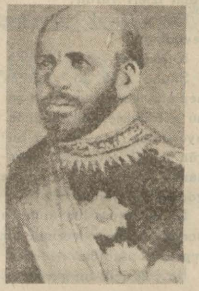
Habeş ordusunun kamutan- larından Ras Kassa

Londra, 22 (A.A.) — Ras Kassa kuvvetleri de mü- temadiyen Kuzey ve Kuz doğusuna doğru ilerlemek- tedirler.