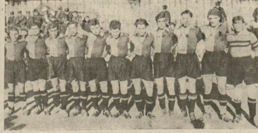
Bölgemiz birincisi İdmanyurlu

Bölgemiz birincisi Yurt takımı oyunda hâkim bir vaziyet aldı. Birinci haftayında bir, ikincide de bir gol atarak Bursa bölge birincisini sıfıra karşı iki golle mağlûp etti.