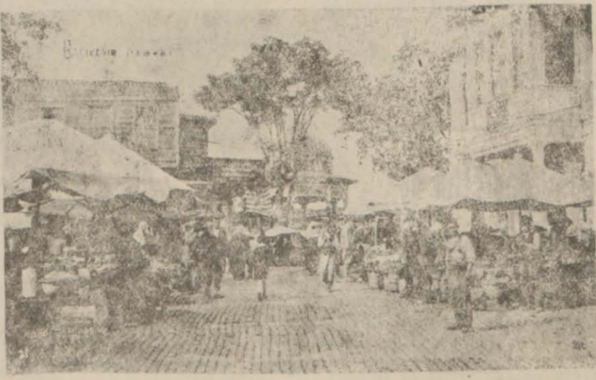
Belediye dairesi ve meydanlık

İşte Cumhuriyet Halk Fırkasının siyasi fırka isimlerinin çok fevkindeki bu yüce manaya bugün işaret etmekteki maksadımız önümüze milli birliğimizi ve her noktada beraberliğimizi bütün cihana tekrak gö-