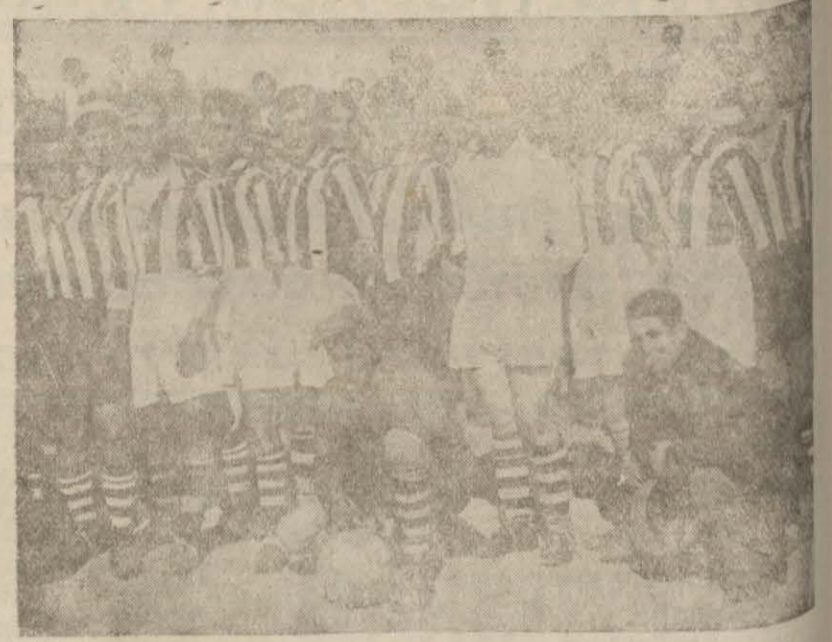
İdman birlikleri bir maçtan sonra.

İdmanyurtlular izmire, Güçlüler Gönene gidiyorlar.