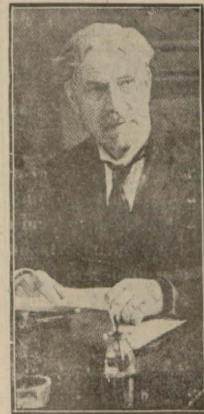
İngiliz Başvekîli M. Makdonald

İmparatorluk müdafaa komitesi İngiliz kabinesi azasının iştirakile bir içtima yapmıştır.