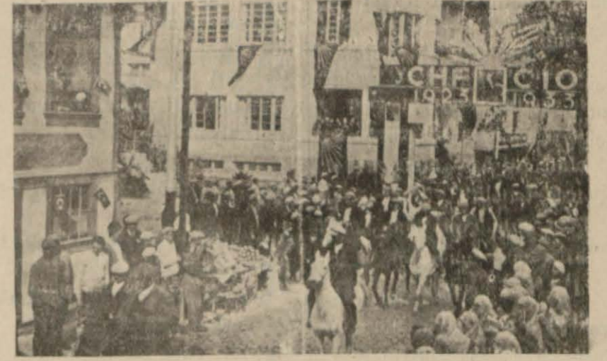
Büyük bayramın onuncu yıldönümünde köylüler firka merkezi önünde