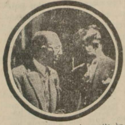
Dün mecliste mühim beyanatta bulunan Hariciye Vekili Tefik Rüştü B.

Büyük Millet Meclisimizin açılması Marsilya cinayeti karşısında duyduğumuz büyük elemnin bir defa daha tezahürüne meydan verdi. Hariciye Vekili beyanatta bulundu.