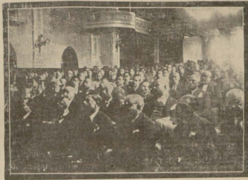
Büyük millet meclisi içtima halinde

Büyük Meclis Hariciye Vekilimizin beyanatından sonra hükümetin harekâtını tasvip etti. Ve alçakça cinayete karşı nefretini izhar eyledi.