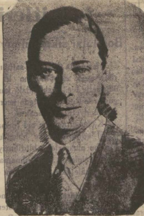
İngiliz Kralı Altıncı Jorj

Londra : 11 [ Radyo ] — İngiliz Kralı Altıncı Jorj, soguk algınlığından rahatsız bulunduğundan Doktorların tavsiyesi üzerine Saraydan bir kaç gün çıkmayacağı gibi bir hafta müddetle de Devlet umurle uğraşmayaak ve yine bu müddet içinde hiç bir kimseyi huzuruna kabul etmeyecektir.