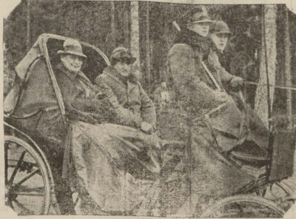
Göring bir köy gezintisinde

Şanghay : 7 (Radyo) — Alman hükümetindeki değişiklik Çin mehafilinde iyi karşılanmamıştır. Aynı mehafil, bilhassa Fon Noyrat gibi, Çin — Japon hadiselerinde iyi neticeler elde etmediği gözetilen bir zatın işba-