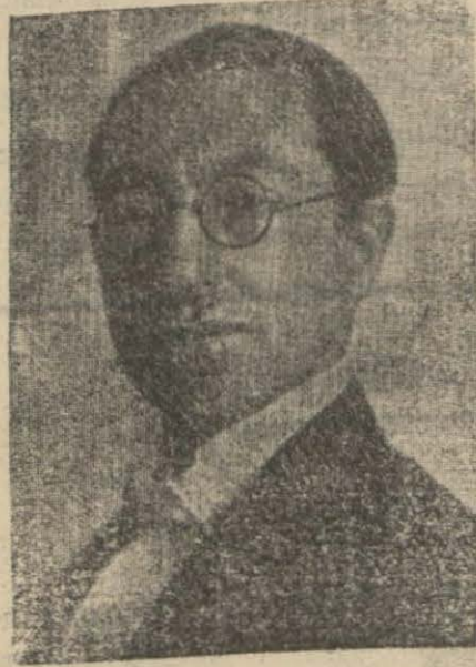
Tevfik Rüşdü Aras yapmaları da ihtimalden uzak değildir.

Kont Ciyanonun Ankara seyahati henüz katıyet kesbetmiş değilse, bu seyahati Rüşdü Arasla birlikte