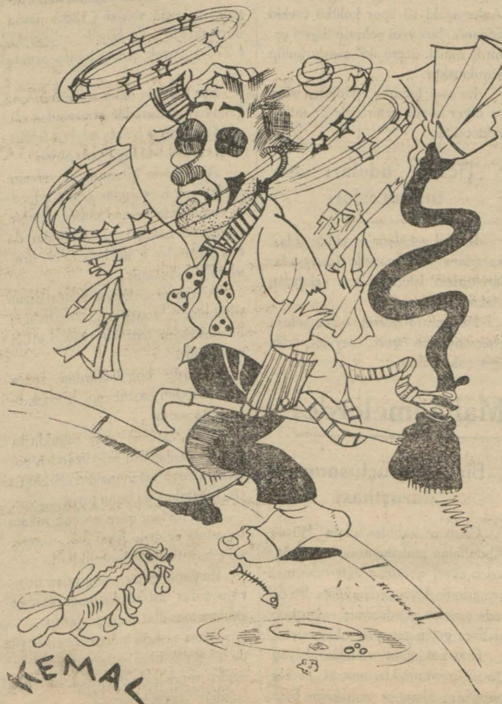
Sarhoş — Aman Allahım bende mi fütürüst oldum !