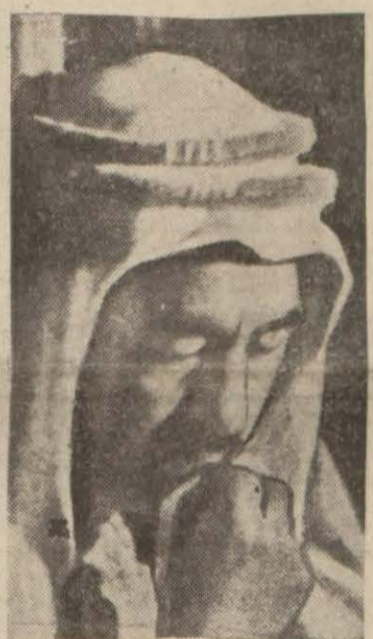
Müttehid Arap krallığına namzed gösterilen Maverayı Erdün Emir Abdullah

İttihada Suriye Lübnan ve Maverayı Erdün dahil olacak