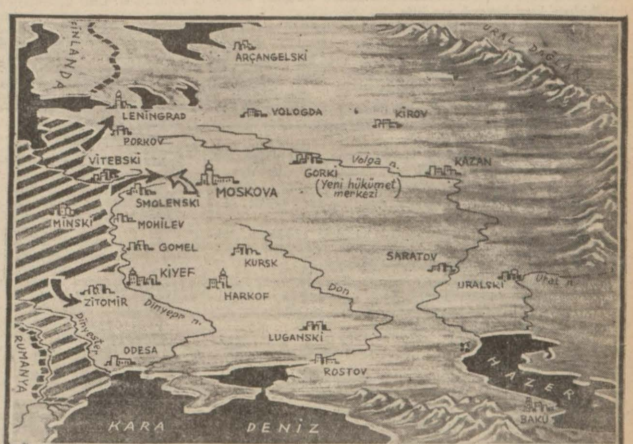
Sovyet Rusyanın Avrupadaki arazisini ve bu günkü harp mintakasını gösterir harita

Müttehit krallığa namzed olarak Maverayı Erdün Emir Abdullah gösterilmektedir.