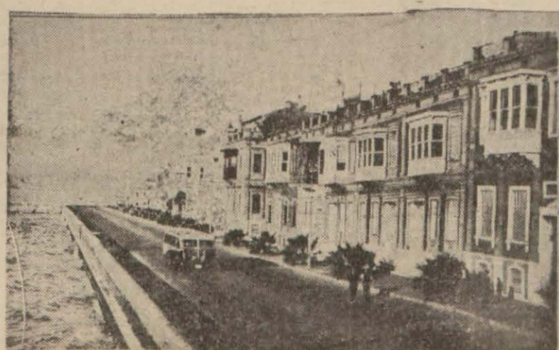
Enternasyonal Fuarın açılması bir kat daha güzelleşen İzmirden bir görünüş

Türk sporu ve Türk gençliğine yakından alakadar olan gazetemiz, geçen sene yapmış olduğu büyük deniz yarışlarına gösterilen alakadan kuvvet bularak her sene gençlik klüpleri ve mükellefler arasında müteallif spor müsabakaları tertip etmeye kararlaşmıştır. Malûm olduğu üzere, memleketimiz deniz sporlarına çok elverişli olduğu halde, gençlik kendini bu temiz spora layikle kaptırmamıştır. Burada kükrek sporunun vücude olan faydasından bahsetmeyi zait addediyoruz. Temennimiz, gençliğin her sporu mevsiminde yapması ve her spora, lazım olan ehemmiyetle bağlanmasıdır. Bu mevsim «Tasvirî Efkâr Şildi» namı altında, gençlik klüpleri arasında büyük bir deniz yarışı daha tertip ediyoruz. Bu defaki yarışın şekli peyzenidir. Ve memleketimizde ilk defa yapılacak olan bu büyük müsabakanın azami derecede güzel olması için bütün müşkülere rağmen lüzumunu tertibatı almaya ve noksanları ikmal etmeye çalışmaktayız. Pek yakında tarihini ve şeklini ilân edeceğimiz bu büyük kükrek yarışına: Kâğıtspor, Hereke, Beykoz, Fenerbahçe, Galatasaray, Güneş, Beylerbeyi, Anadolu Gençlik klüplerinin kükrek ekipleri sizleri davet ediyoruz. Tasvirî Efkâr bu müsabakaları sizler için açıyor