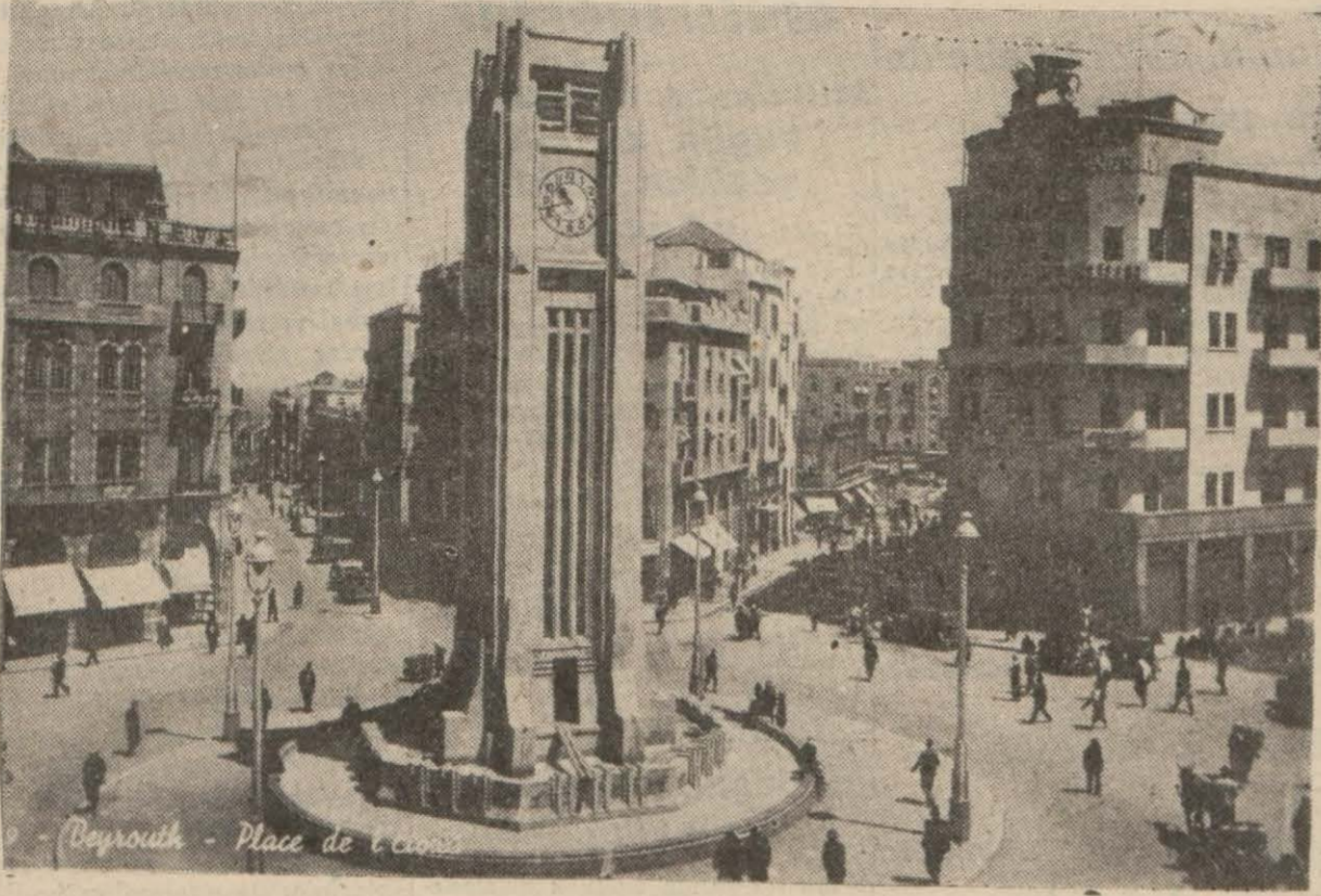
Suriyenin merkezî Beyruttan bir görünüşü