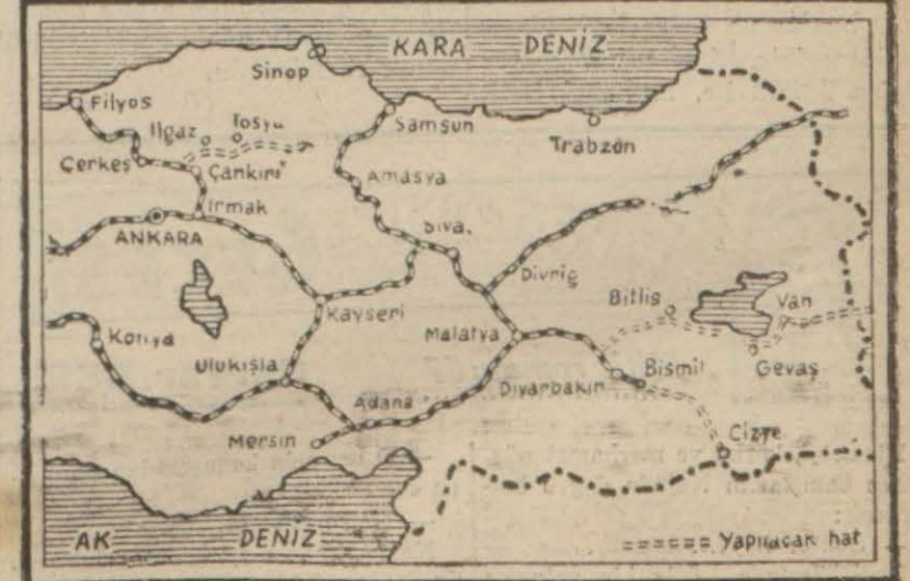
Hükümet tarafından münakasaya çıkarılan iki demiryolu hattının güzergâhını gösterir harita

Yurdumuzu baştan başa çelik ağlarla örmeğe için Cumhuriyet hükümetinin sarfetmekte olduğu büyük gayretler feyizli semerele- rini vermektedir. Memnuniyetle haber aldığımızı- za göre, Nafia Vekâleti bu hu-