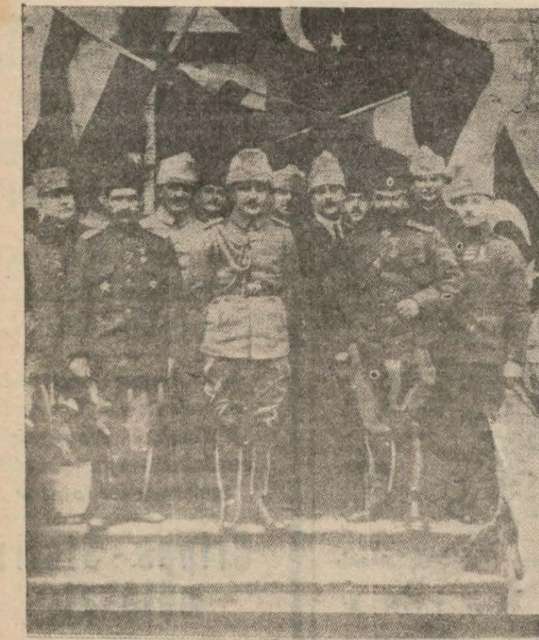
Enver Paşa, umumi harpte Bulgaristanda (Sağdaki kılıklı, Bay Hüseyin Cahit'tir)