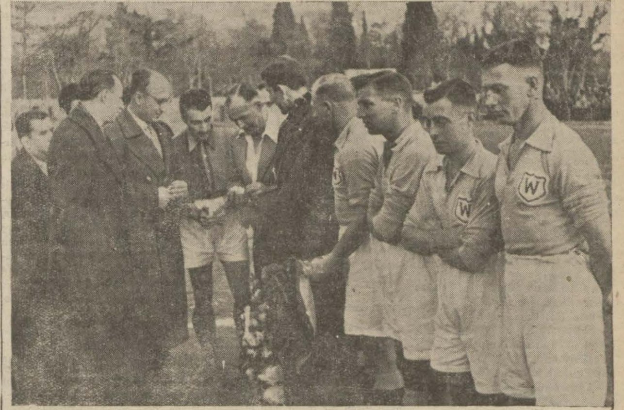
Hakem parayı atıyor. Kaleler seçilecek

Galatasaray Ankaradaki gösterdiği oyuna tamamilen zıd bir oyunla mağlup oldu