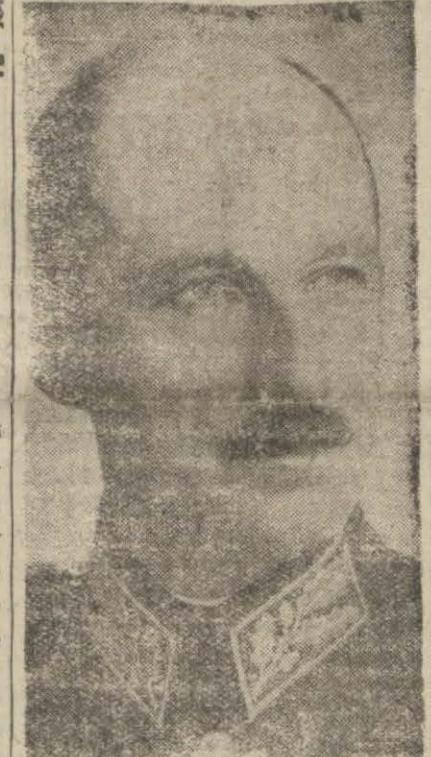
Bulgar Kralı Boris