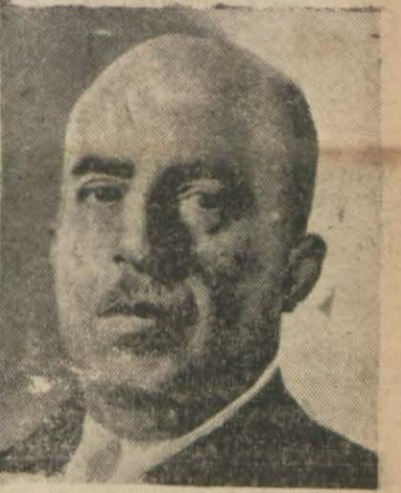
Mısır Başvekilli Huseyin Sabri Paşa