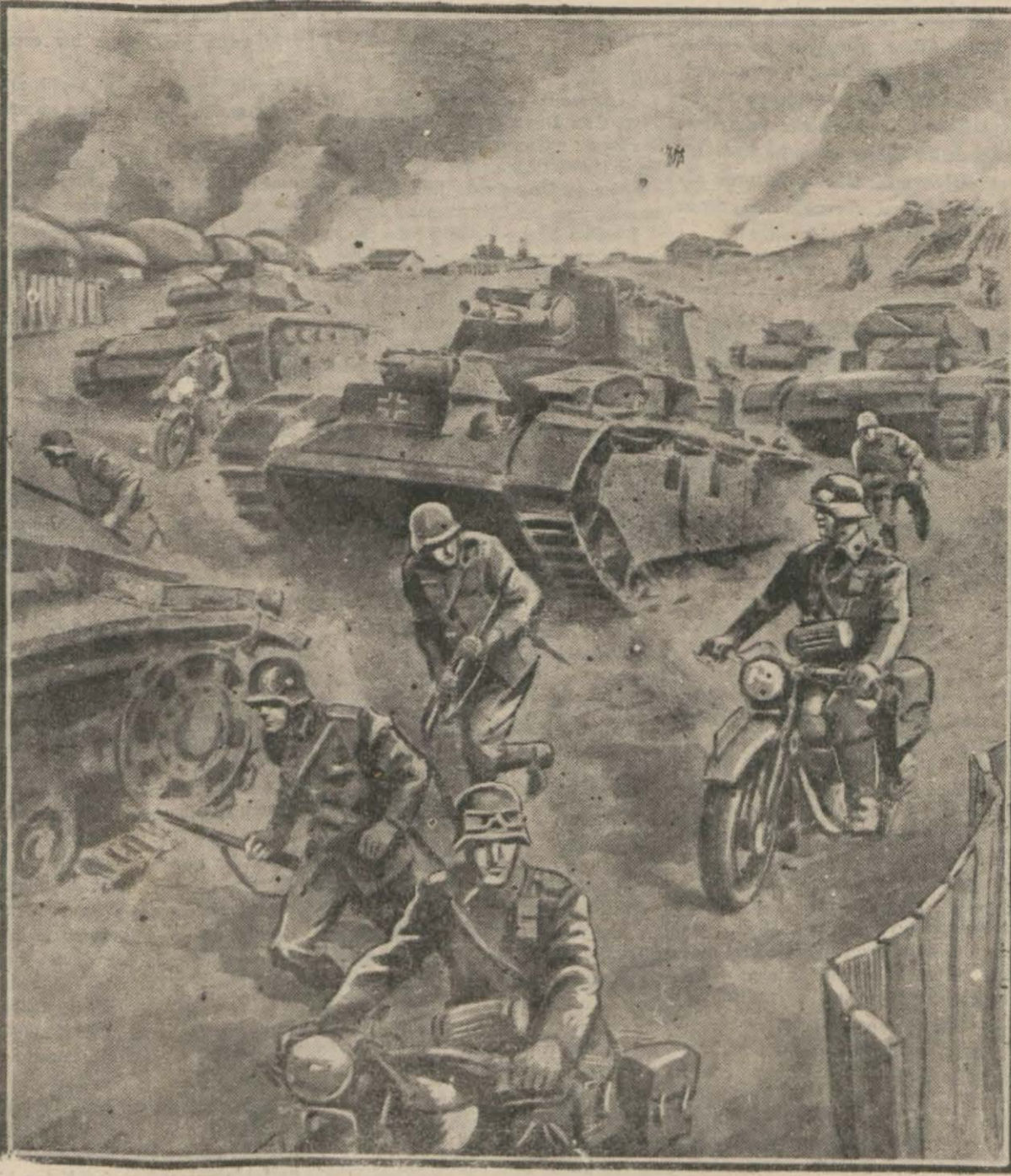
Alman motörlü kuvvetleri ilerlerken...

Malum olduğu üzere, hüküme- timiz fevkalâde ahval sebebiyle memleketimizde bir miktar buğday stoku yapmış ve bu sebeple yeni mahsul elde edilinceye kadar ek- meklere muvakkaten arpa ve çavdar karıştırılmıştır. Şimdi ye- ni mahsul elde edilmiş olduğun- dan böyle bir tedbir lüzum kal- mamıştır. Yeni kararın tabikine önümüzdeki pazartesi gününden itibaren başlanması kuvvetle muhtemeldir.