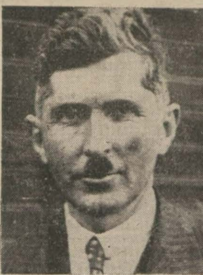
Yeni İktisat Vekili Sırrı Day

ANKARA, 1 (A.A.) Sıhhi durumunun müsait olma- sından dolayı İktisat Vekilli- ğinden 31 temmuz 1941 tarih-