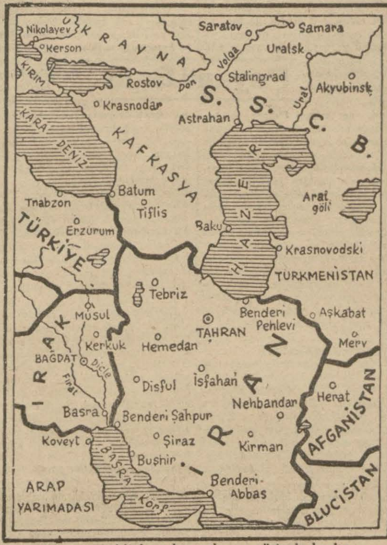
İrânın mevkiini ve komşularını gösterir harita