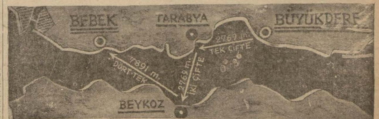
Yarışların yapılacağı hatları gösterir kroki

Gazetemiz 30 Ağustos Zafer Bayramı günü merhaleli kürek yarışları tertip ediyor