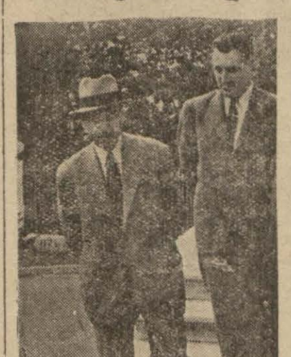
Dahiliye Vekili vilâyette çıkarken

Bütün muhtaç asker âilelerine yardım edilecek—Ankara ve İstanbul Valilerinin değişeceği haberi asılsız