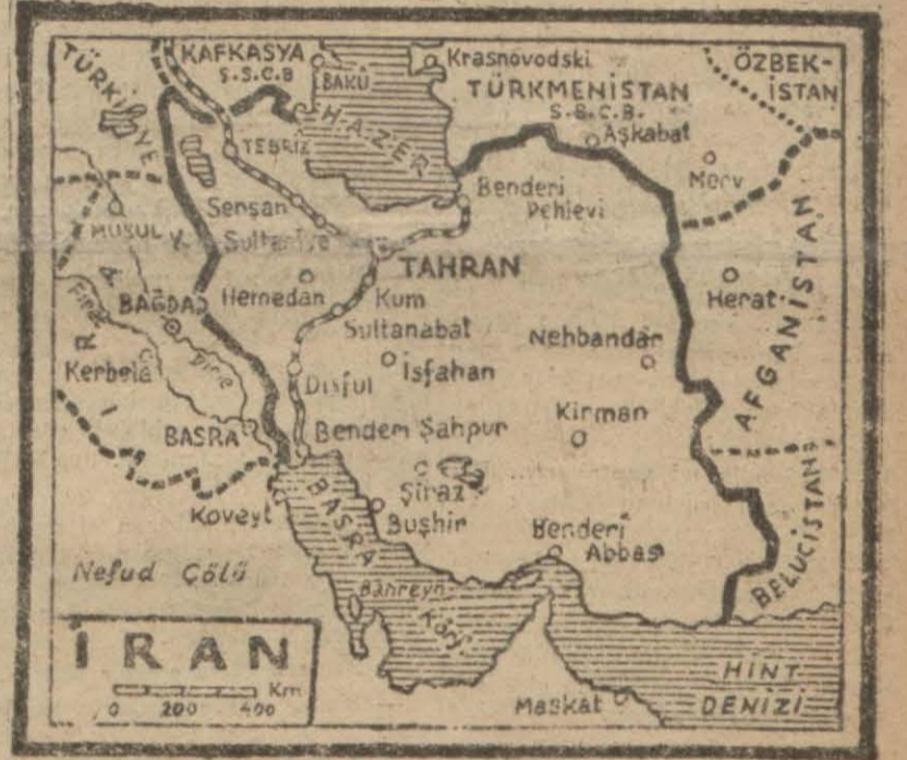
İrânın bugünkü coğrafi ve siyasi mevkiini gösterir harita