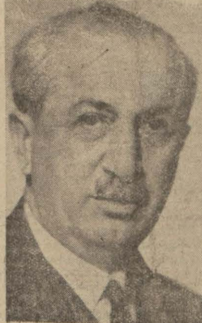
Millî Müdafaa Vekili Saffet Arıkan