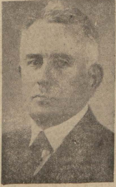
İstanbul Meb'usu General Kâzım Karabekir