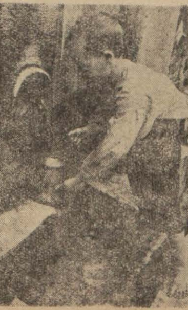
Kapatılan Kırkçeşmelerin biri den son su içilirken

Artık cümlelerin malûmut Tırnak sürtüştüren politika Türk milletinın ve devletinın siyasi dirayetine tuzağa düşürmekten başka bir hedef kollamıyor. Son günlerin bir sürü şayialarına Türk basınının cevabı ve Türk halkının anlayışlı kayıtsızlığı bu politikanın iflâasına en son ve en canlı delil.