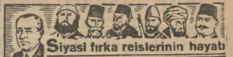
Siyasi frıka reislerinin hayatı