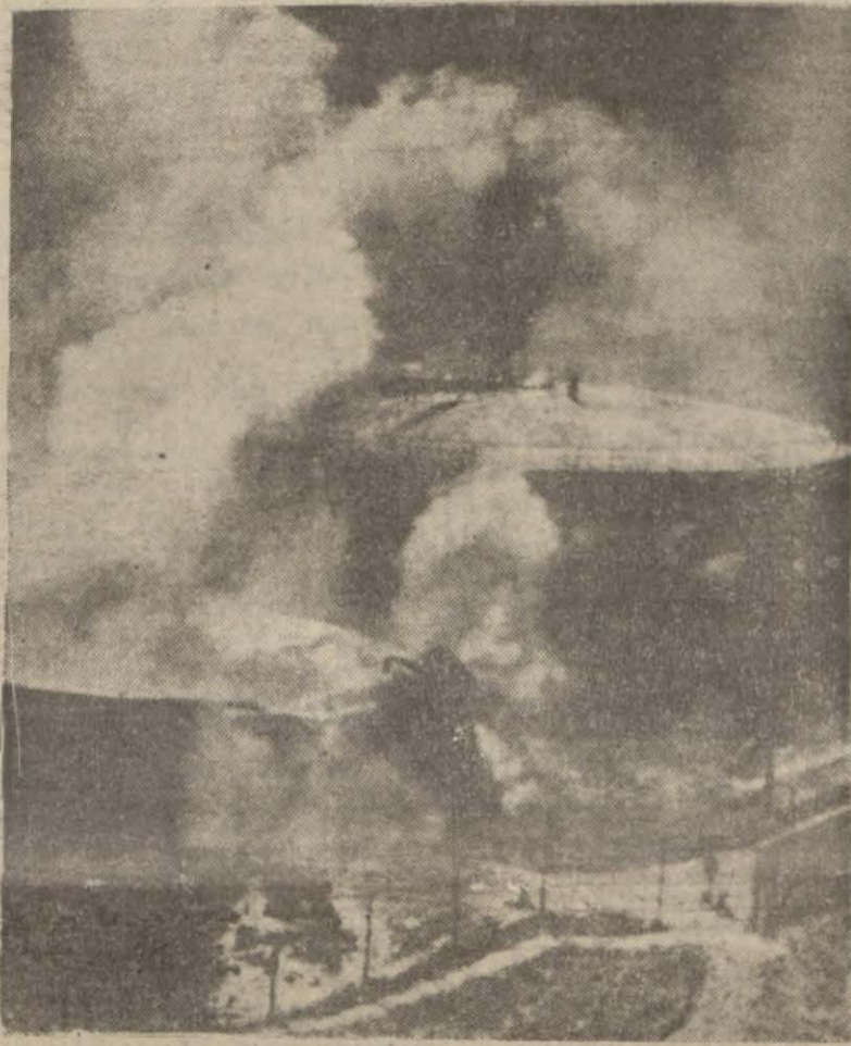
Tayyare hücumuna maruz kalan bir petrol deposu alevler içinde yanarken