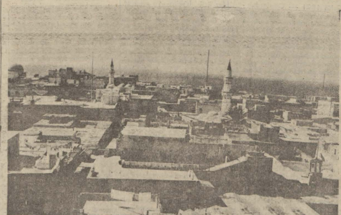
1911 de Osmanlı İmparatorluğundan zorla alınan Trablusgarp şehrinin umumî görünüşü

Bu kanuna ilâve edilen madde şöyle demektedir: Ordu veya donanmaya ait bulunan veyahut ordu veya donanma için sipariş edilmiş olan (Devamı sayfa 5, sütun 7 de)