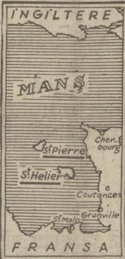
Manş denizinde İngilizlerin St. Helier ve St. Pierre adalarını gösterir harita

Donanmaya mensup tayyarelerimiz, dün akşam, Rotterdam (Devamı sayfa 5, sütun 4 te)