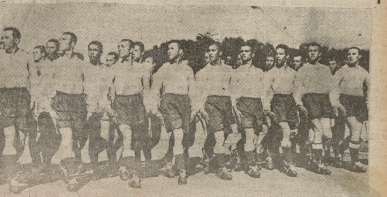
Askerî mekteplerin spor şenlikleri dün saat 16 da Kadıköyündeki Fenerbahçe stadında yapılmıştır. Bir çok büyük rütbeli komandanlarımızı huzurunda icra edilen şenlikler çok muvaffakiyetli olmuş ve taktirle karşılanmıştır. (Tafsilat 6 ncı sahifemizde'dir)