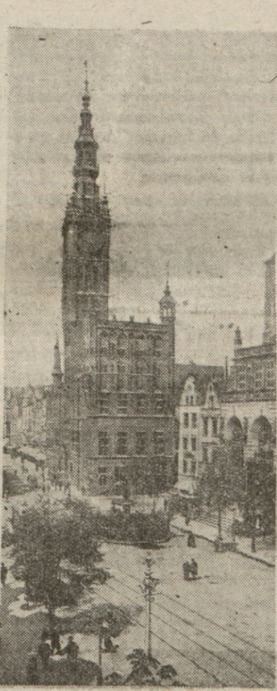
İçinde bulduğumuz kanlı boğazlı şmanın sebi olarak gösterilen şehir: Dantzig

«Haşmetpenah, siz Kayzer Wilhelm halazadesi olabilirsiniz