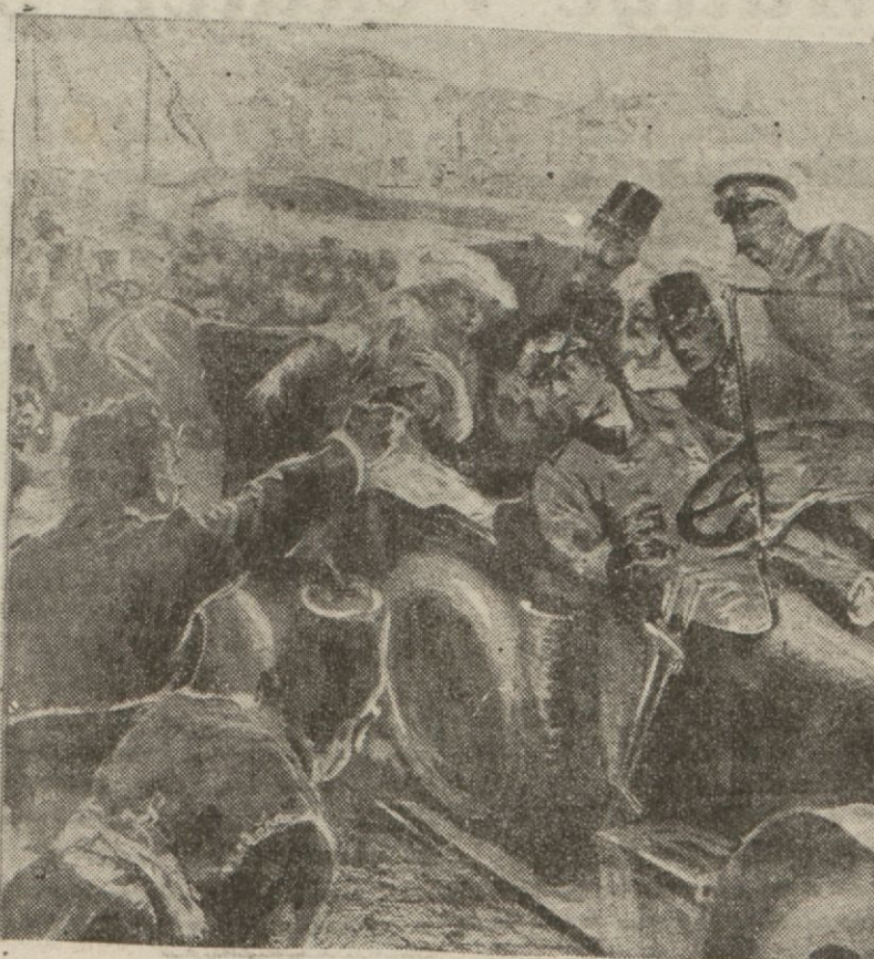
27 sene evvel bugün başlayan 35 milyon insanın hayatına malolan Cihan Harbinin zahiri sebebini teşkil eden vak'a; Avusturya - Macar İmparatorluğu Veliahdinin katli

Tam yirmi altı sene evvel yine böyle sıcak bir temmuz sabahı, 28-7-1914 salı günü üç Avusturya-Macar kolordusu küçük Sırbistanın hududunu şafakla geçmiş ve Tunaya karşı Dravar Sava sularının cenubunda ilerlemeye başlamıştı.