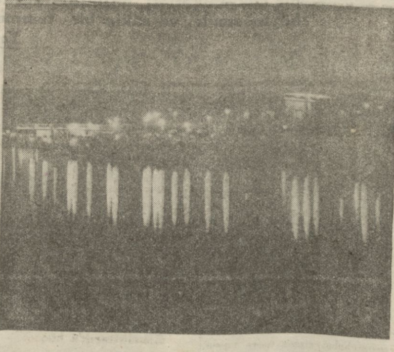
Fuarın gece görünüşü

İzmir, (Hususi) — Da-bu sene de Elen pavyonunu hu-susi bir itina ile hazırlanmaktadır. Elen pavyonu, bir dostluğun sem-bolü olduğu kadar son sene için-de inkişaf eden iki memleket ti-carı müdâfelerinin bir bilançosu-nu ziyaretçilerine anlatacak husu-siyetler taşımaktadır. Büyük Britanya hükümeti, harp halinde bulunmasına rağmen bu sene fuarımızda gayet geniş bir pavyon hazırlamakta-dır. Bu pavyon, sergi sarayı dahi-linde büyük bir parselin tamamını teşkil etmektedir. Geçen sene Almanya tarafından isticari edil-miş olan bu parselde Türk - İn-giliz iktisadi teşriki mesaisinin müsbet neticelerini gösteren gra-fikler, İngiliz sanayi sitelerinin çalışmaları neticesinde elde ettikleri randmanlar gösterilecektir. Müttefik ve dost Yunanistan,