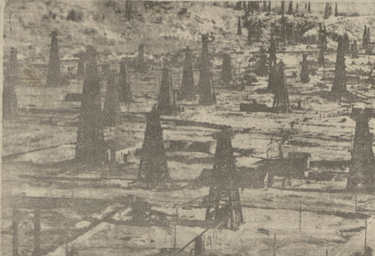
Rumanya ile İngiltere arasındaki siyasi hâdiselere sebebiyet veren Rumanya petrol kuyuları