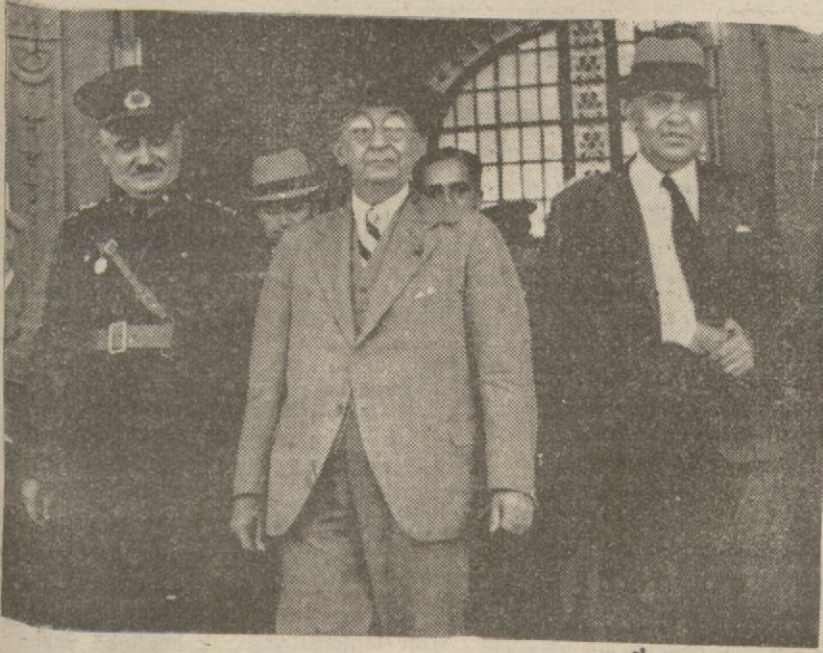
Başvekil Haydarpaşa istasyonundan çıkarken.