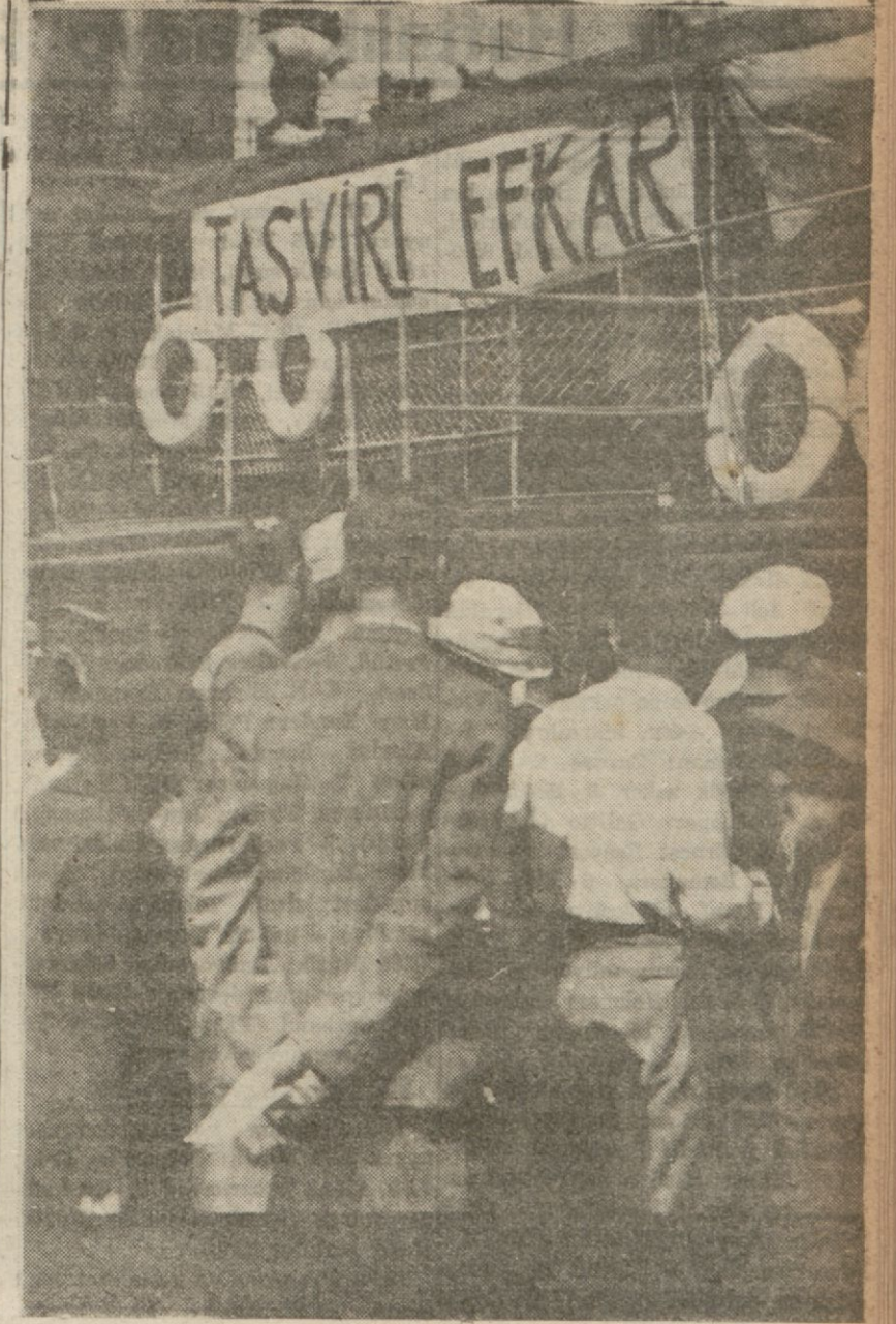
Karilerimiz köprüde kendilerine tahsis ettiğimiz vapura biniyorlar