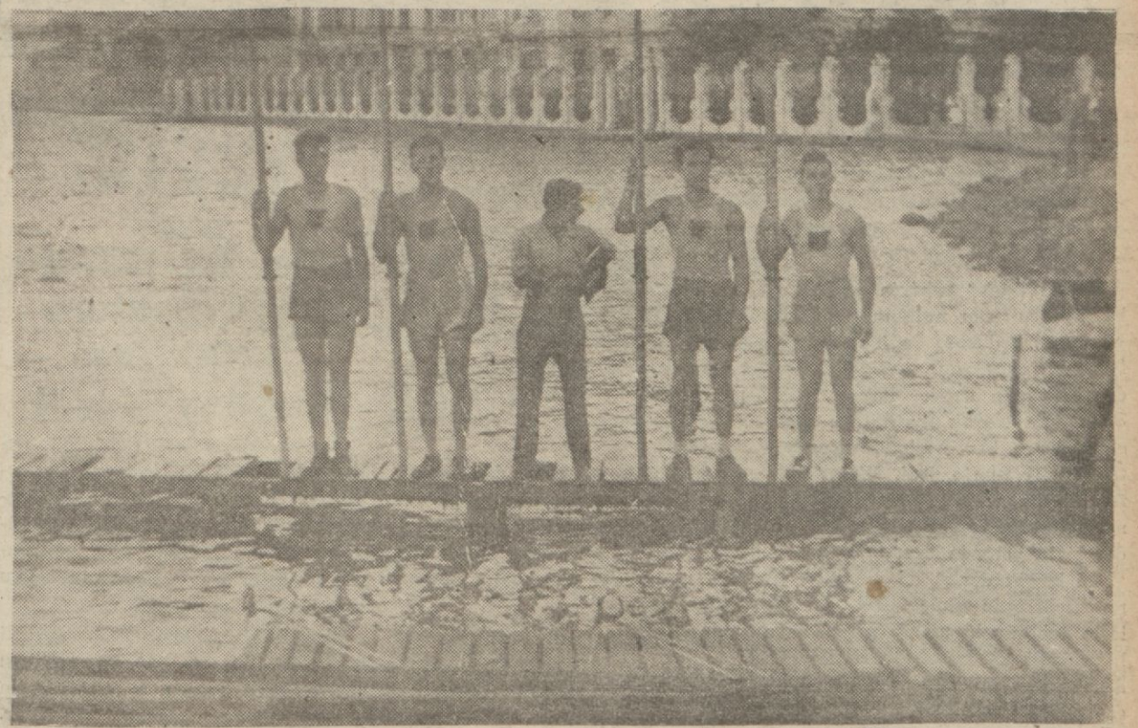
Tertip ettiğimiz yarışların birincisi; Galatasaray ekibi

Başvekilin şehrimizde kısa bir müddet kalacağı tahmin edilmektedir.