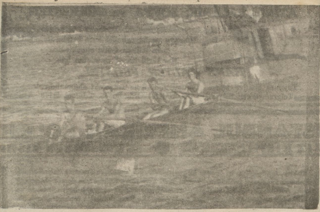
Dünkü kürek yarışlarının birincisi: Galatasaray takımı