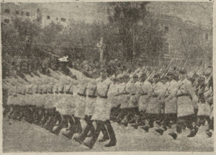
İspanyol ordusunun dağıtılardan bir kısmın geçid resminde

İspanyanın mihver devletlerle harbe girmeğe karar vermesi takdirinde onun daha fazla bir geçit, bir hareket üssü olarak vazife alacağı tahmin edilebilir