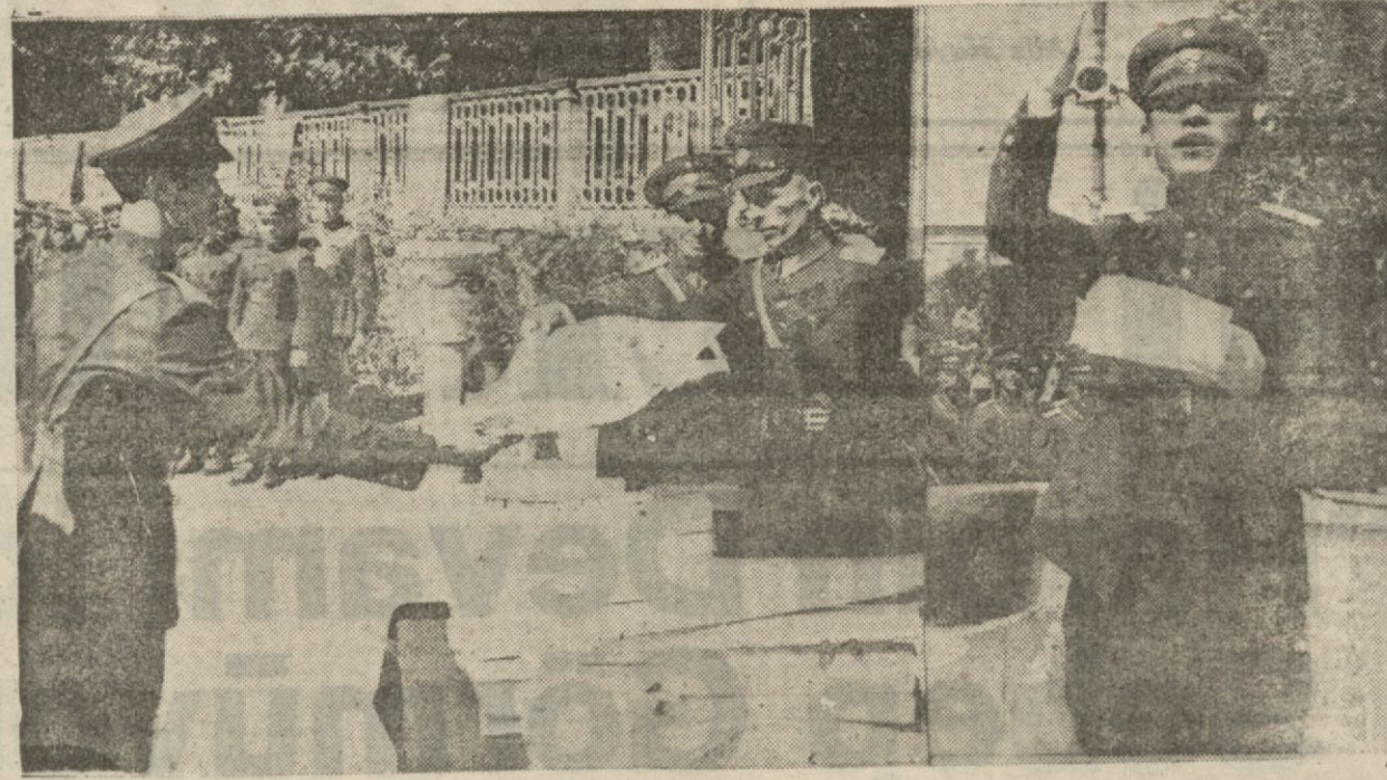
Polis mektebinin yeni mezunları diploma alıyorlar ve Taksim âbidesinde nutuk söyleyen bir mezun

Yeni ekmeğe çenisinin ilk tecrübeleri yapılmaktadır. Bir çuval un - 98 ekmeğe çıkarılmaya başlandı. 98 ekmeğe çıkarılmaya başlandı. 98 ekmeğe çıkarılmaya başlandı. 98 ekmeğe çıkarılmaya başlandı.