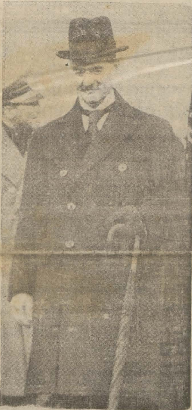
İngiltere Başvekili Chamberlain