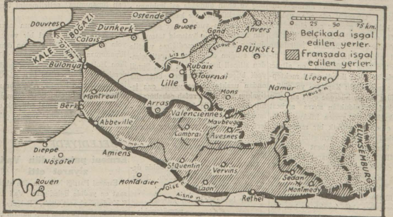
Dün Almanların Boulogne'ü almaları üzerine son vaziyeti gösterir harita

ya ikiye böleceklerini, yahut ihata ederek imha edileceklerini yazıp durmuşuk. Halbuki dünkü haberler, harekâtın büsbütün makûs bir cereyan olarak, Almanların Manş istikametinde şerit gibi vaziyetlerini bilâkis genişlettiklerini ve hattâ Manş üzerindeki Boulogne limanını da ele geçirdiklerini bildirdiler. (Devamı 7 nci sayfamızda)