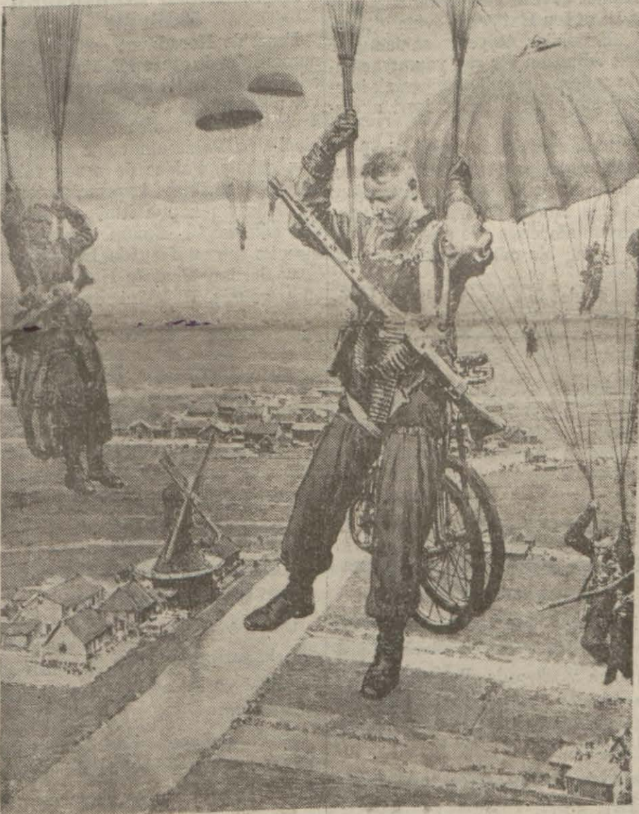
İngiliz mecmualarından iktibas ettiğimiz bu resim Alman paraşütçülerinin nasıl atıldıklarını ve üzerlerinde ne gibi teçhizat taşındıklarını göstermektedir. Bir nefer yanında bisikletle inmektedir.

Londra, 24 (Hususi) — Röyterin salâhiyyetdar Londra mahfellerinden aldığı haberlere göre Almanlar dün gece Boulogne şehrini ele geçirecek Manş denizine inmeğe muvaffak olmuşlardır. Röyterin tahminlerine göre Almanlar Boulogne'de müttefiklerin müdafaa kuvvetlerine faik kuvvetlere malik bulunuyorlardı. Haberlerin halka kadar gelmesine mâni olmak arzu edilmemekle beraber, bugün burada bildirildiğine göre Alman müfrezelerinin vardıkları veyahut püskürtüldükleri mahaller hakkında malumat verilmemekteyiz. Filhakika, birçok defa bu müfrezeler infirat halinde ve umumî karargâhları ile muhabere teminine gayri muktedir bulunmaktadır.