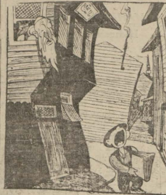
Onlar böyle yapmışlardı

(Akşam) güzel bir (intaki hak) ile geçen gün molla tabirini kullanmıştı. Bu meşhur molla tabiri Necmüddin ismi o kadar birbirine ya-