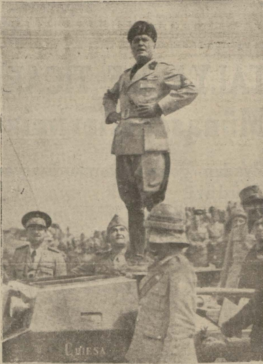
Mussolininin maruf pozlarından biri

İtalyan gazeteleri “İtalyanın harp içinde bulunduğunu unutmamak lâzımdır,, diyorlar