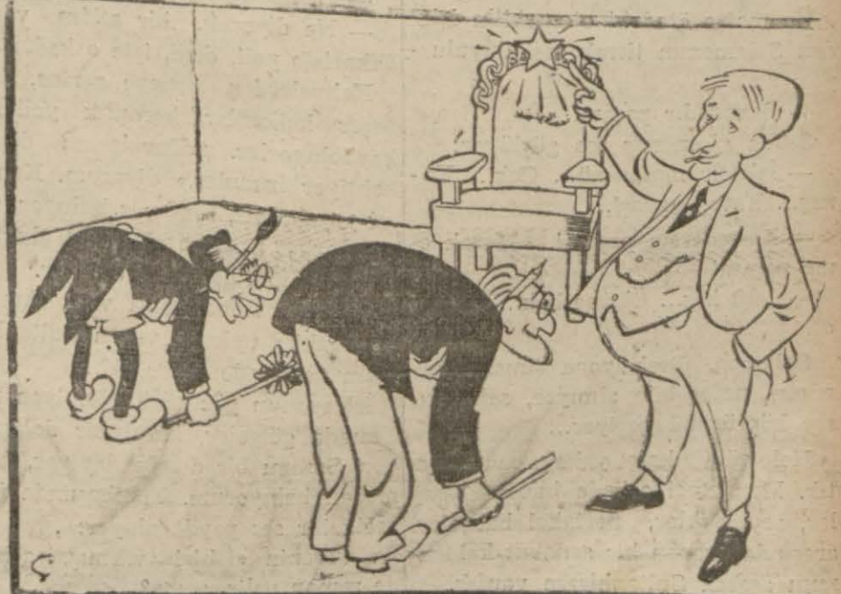
... Biz bu kadar yaptık

(Akşam) güzel bir (intaki hak) ile geçen gün molla tabirini kullanmıştı. Bu meşhur molla tabiri Necmüddin ismi o kadar birbirine ya-