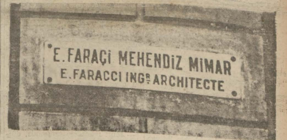
Göze batan acayip şiveli levha

Misafirperverlikten bu kadar fazla istifade edilmez doğrusu