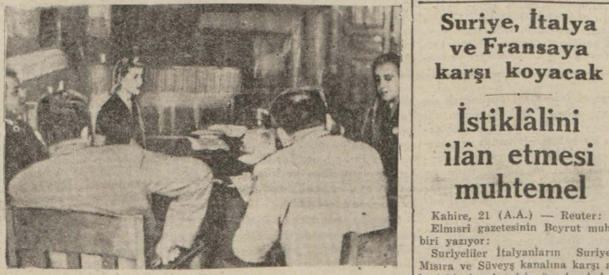
Talipler Galatasaray lisesinde imtihan oluyorlar

Bir zabit kâtipliği veya mukayyitlik için yüzlerce talip çıkaran koskoca İstanbulda tiyatro mektebi imtihanına 15 genç girdi ve üç kişi kazanabildi!