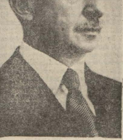
Reisicümhur İsmet İnönü

İnönünün İzmir ve Bursaya da gitmeleri muhtemel