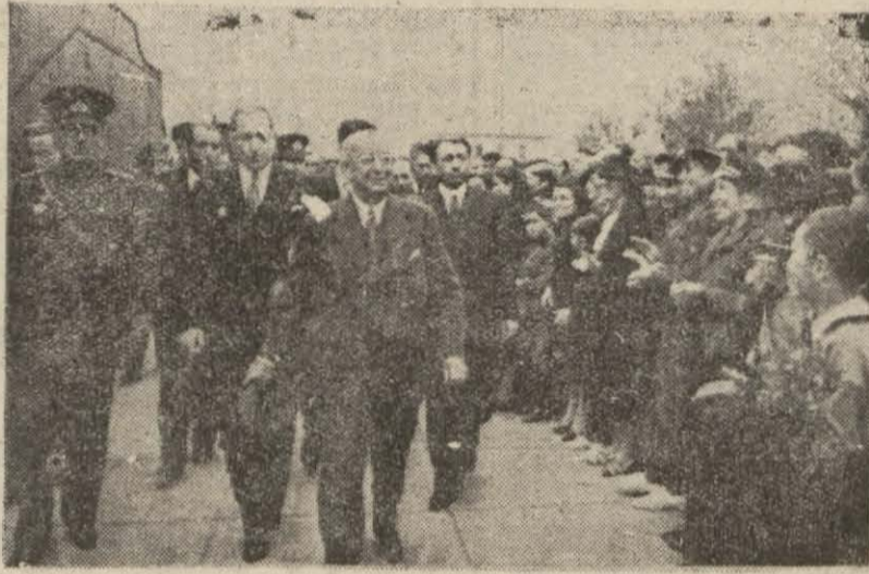
Başvekilimiz tetkik seyahatlerinden birinde

Müteakiben Vilâyet konağında bir müddet istirahat eden Başvekilimiz saat 20,30 da seferlerine tertip edilen Turizm otelinde 100 kişilik ziyafette bulunmuşlardır. Bu ziyafet Vali konağı bahçesinde verilen bir kabul resmi takip etmiştir. Hatay, hükümet reisimizi aralarında gördüğü bu gece bayram yapmaktadır. Her taraf donanmıştır. Halk memnuniyet ve heyecan içinde, İskenderun Antakya'ya kadar yol üzerinde civardaki kazalar ve kayıplar taklar yapılmışlar ve yüzlerce atlı ve yayla halk, Başvekilimizi heyecanla alkışlamışlardır.