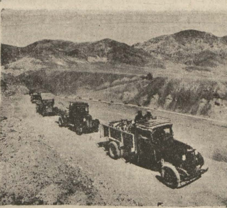
Gulsman krom madeninden cevherler kamyonlarla sevkedilirken

Ankara, 2 (Telefonla) — Amerika ve İngiltereye elli bin ton kadar krom satılması hakkında yakında müzakerelerin başlayacağı haber verilmektedir. Etibank Sark Kromları İdaresinin elinde, 939 senesinden otuz küsur bin ton kadar bir stok vardır. 938 de 208.405 tonluk bir ihraçata mukabil, 939 senesinde harp vaziyeti dolayısıyla bu miktarın yüzde sekiz eksikliğe 191.644 ton ihraçat yapılmıştır.