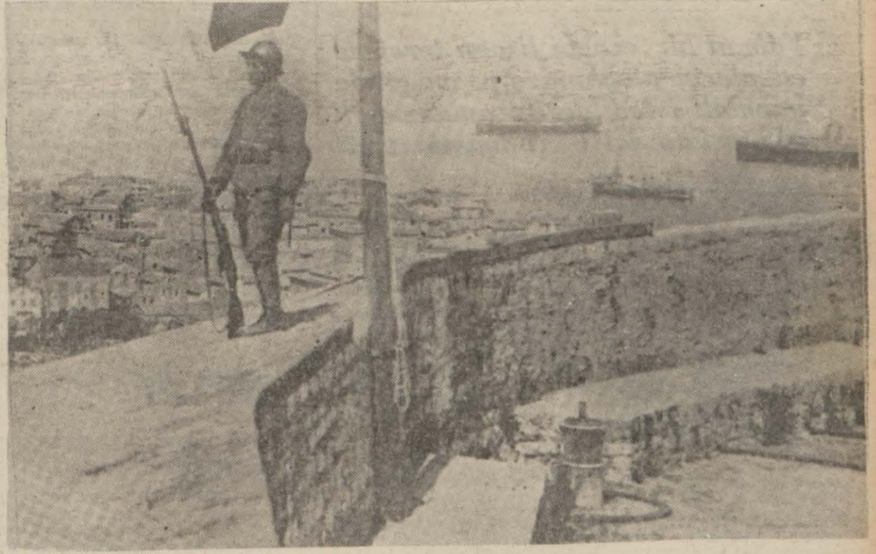
Davut Hoca cinayeti 1923 te olduğu gibi İtalyan - Yunan münasebatını gerginleştirmiştir. (Yukarıki resim 1923 işgalinde Korfu istihkamlarında nöbet bekleyen bir İtalyan neferini göstermektedir.)

İstiklâlin ve vatanın Şanlı bekçisi Mehmetcik