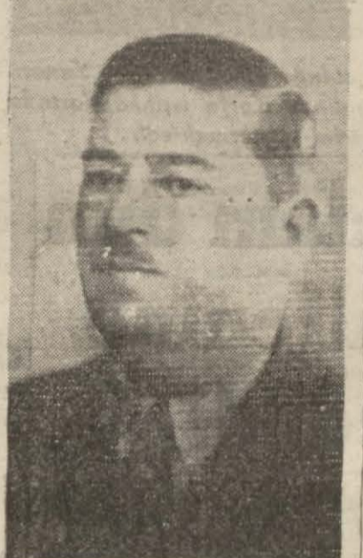
Ercüment Ekrem Talu