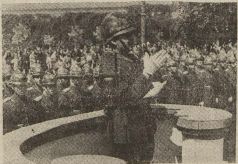
Polis okulunun eli beşinci devresini bitiren 190 zabita memurumuz dün saat on birde önlerinde şehir bandosu olduğu halde merasimle Takسیمe gelecek Abideye çekilmeye hazırlandı. Yeni mezunların diplomaları yakında okul binasında yapılacak törende verilecektir.