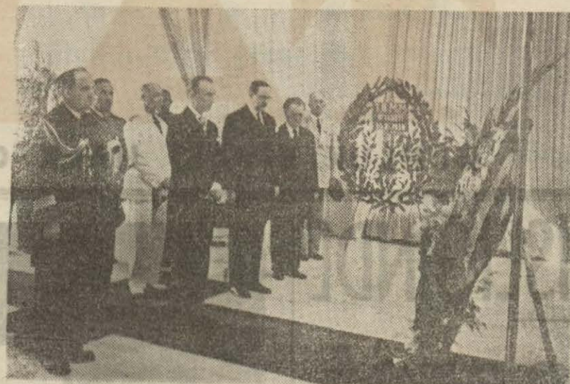
Yeni Fransız Büyükelçisi M. Gaston Bergery'nin evvelki gün Atatürk'ün muvakkat kabrini ziyaret ettiğini yazmıştı. Bu resimde, büyükelçi ile maiyetini bu ziyaret esnasında görüyoruz.

Dün altın biraz yükselmiştir. Bir altın 2895 kuruştan ve bir gram 393 kuruştan satılmıştır.