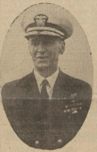
Amerikan donanması başkumandanı Amiral King

Berlin, 2 (A.A.) — Alman başkumandanlığı tebliği: Şark cephesinin cenup kesiminin şiddetli kar fırtınalarına rağmen yeniden mühim bir faaliyet kaydedilmiştir. Cephenin merkez ve şimal kesimlerinde düşmanın birçok taarruzları geri püskürtülmüştür. Topçumuz Leningrad'ın harp için mühim olan endüstri fabrikalarını müessir bir ateş altına almıştır.