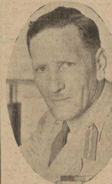
Libyadaki hareketi idare eden General Achinleck

Bu iktisadi seferberliğin hedefi, her gün biraz daha şiddetlenen harbin istisnaları karşısında "istihsalimizi arttırmak, ithalâtımızı ve ihracatımızı ihtiyaçlarımızı göre düzenlemek, gerek hariçten gelen ve gerek dahilide istihsal edilen maddelerin millet fertleri arasındaki dağıtımda adaleti temin etmek ve bilhassa fırsattan istifade ederek halk zararına menfaat temin etmek istiyenlere hayat hakkı vermemek, tir. Bu hedefe varmak için hükümet, gerek işhisal, gerek dağıtım ve gerek harcama işlerinde lüzum göreceği her türlü tedbirleri başvurmak salâhiyetini almıştır. Zira ve sinai istihsalı bu hedefe göre organize edecek, münakale işlerini bu ihtiyaç göre düzene koyacak, ve her bir vatandaşın bütün vatandaşları arasında adil bir esasla devranını paylaşmaya bağlayacaktır. Tedbirlerin müstahkemle ol-