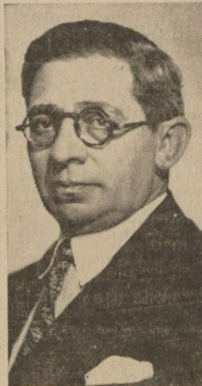
Maliye Vekili Fuat Ağralı

Evvelki gün Büyük Millet Meclisinde millî korunma kanununda yapılan tadilat müzakere edilirken Başvekil ve diğer vekiller izahat vermiş, muhtelif hatipler söz almışlardır. Dün Başvekilin mühim nutukıyla söz alan mebusların hitabelerini neşretmiştim. Bugün de Maliye, Ticaret ve İktisat Vekillerinin memleketin malî ve iktisadi işleri üzerinde önemli noktaları belirten izahlarını veriyoruz.