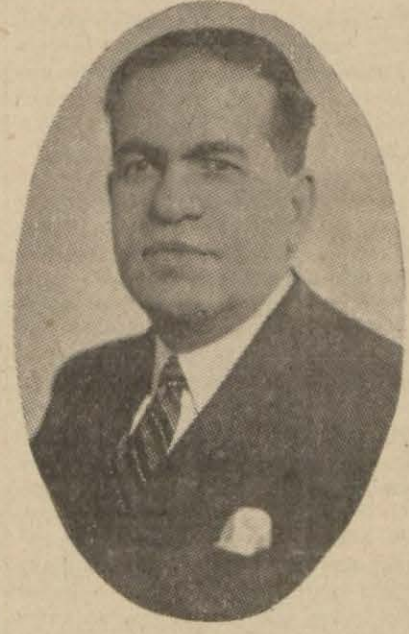
Dr. Lütfi Kırdar

Mahrukat mevzuu üzerinde başlıca üç madde ile yani kok, mangal kömürü ve odun işi ile ayrı