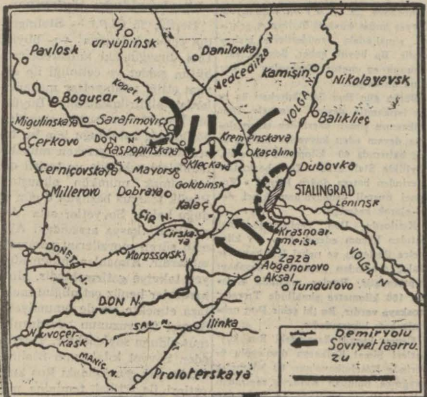
Cephe vaziyetini gösteren harita (Yazısı ikinci sayfamızdadır.)