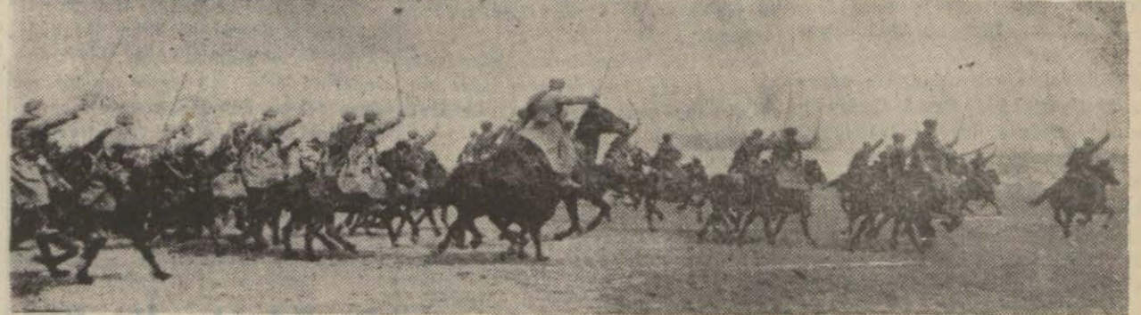
Siberyadan Stalingrattaki muharebe bölgesine getirilen Sovyet süvari taarruzlarına mensup birlik