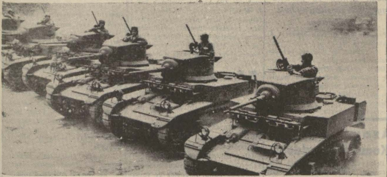
Şimal Afrikada karaya çıkarılan Amerikan tankları