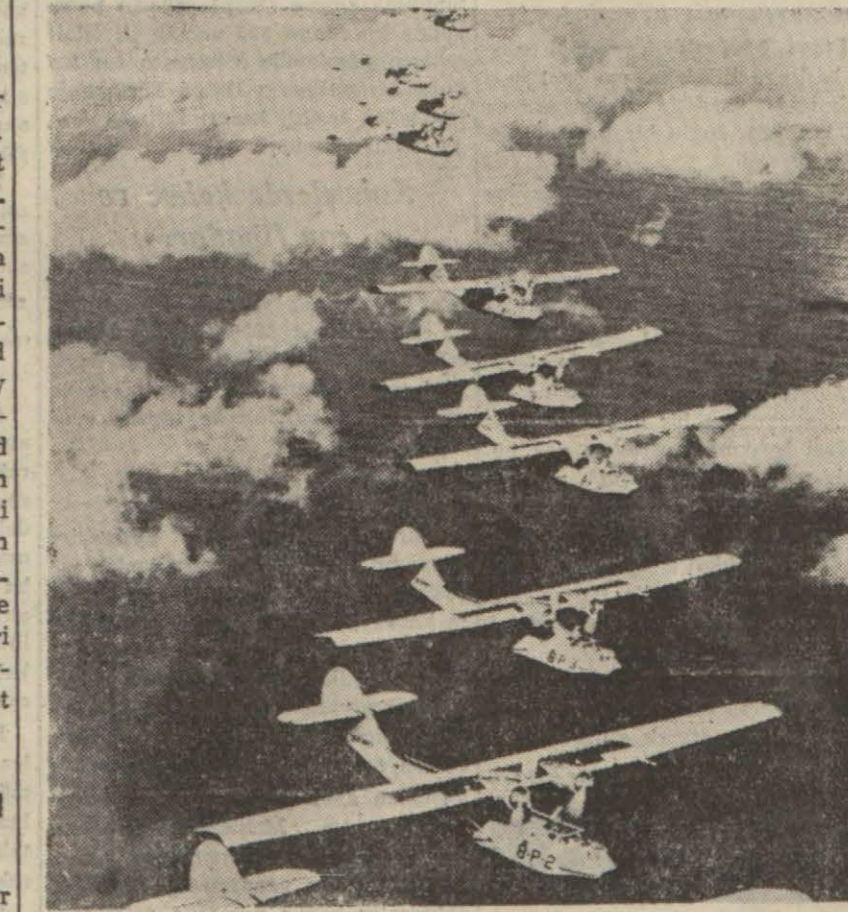
Şimal Afrikaya takviye olarak gönderilen müttefik hava kuvvetlerine mensup bir filo uçuş halinde

Müttefikler Şimal Afrikaya Yeniden Takviyeler Gönderdi - Tunus'taki Mihver Kuvvetleri 10.000 Kadardır