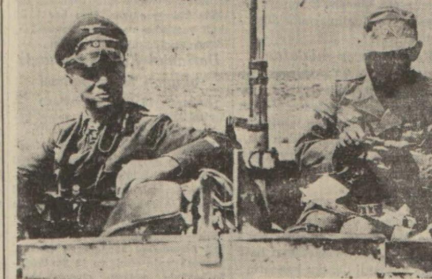
Mareşal Rommel'in hareket sahasında alınmış bir resmi