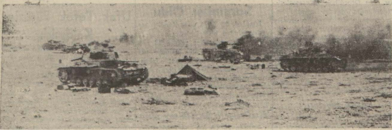
Hâlen şiddetli bir takip harbinin cereyan etmekte olduğu Libya çölünde tahrip edilmiş tanklar alevler içinde yanarken

Sanat ve Ticaret Erbabının Faaliyet Sahaları Dışında Kalan Maddeleri Ticaret Maksadile Biriktirmesi de Yasak Edildi