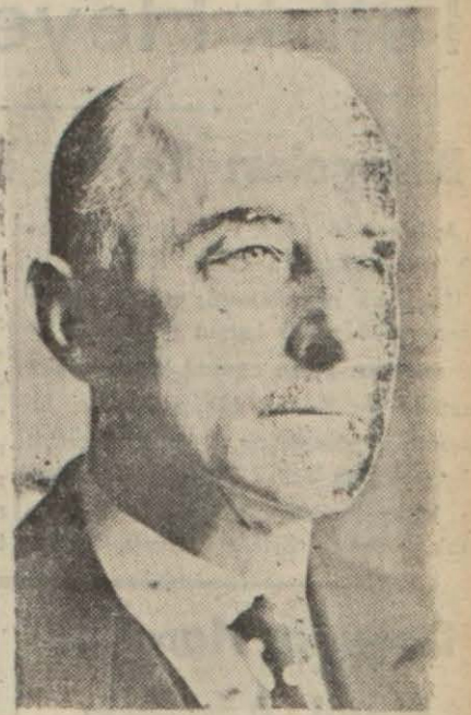
Fas Umumî Valisi General Nogues