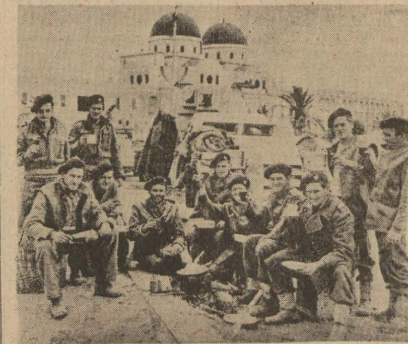
Sirenaik harbine iştirak eden cenubi Afrikalı askerler istirahat

Şehirde elektrik tasarrufuna başlandıktan sonra ilk olarak 1800 lamba söndürülmüştür. Üç gün içinde sabaha kadar yanmakta olan lambaların bir kısmı daha söndürülecektir.