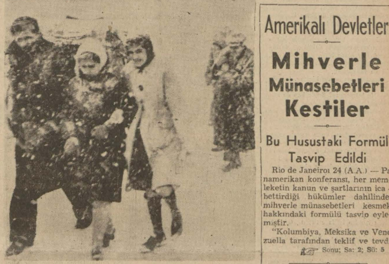
Şehirimizde kış bütün şiddetiyle devam etmektedir. Yukarıki resimler İstanbulun dünkü manzarasını gösteriyor. (yazısı Sa. 2 de)