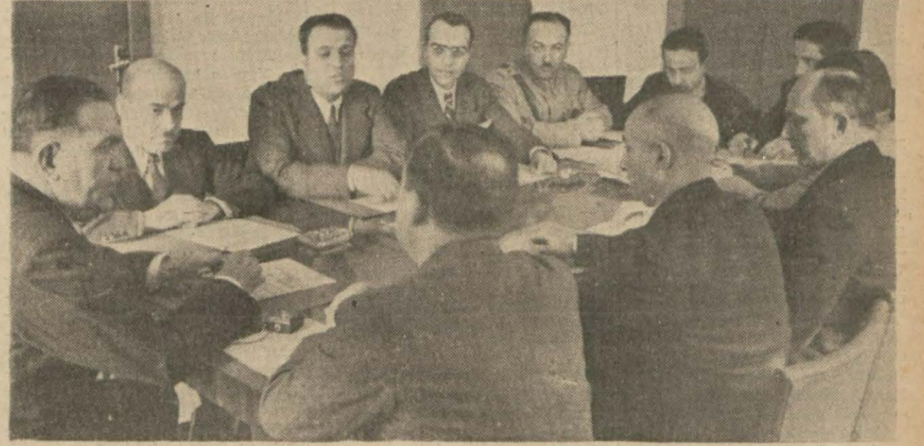
Valinin başkanlığında toplanan fiyat mürakabe komisyonunun dünkü içtimandan bir görünüş (Yazısı ikinci sayfamızdadır.)

Mürakabe Komisyonu, Alâkadar Tacirlerin İştirakiyle Bir Birlik Kurulmasını Kararlaştırdı - Şehre Odun ve Kömür Getirilmesi İşi Bu Birliğin Mesuliyeti Altına Veriliyor