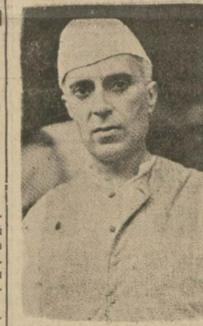
Kongrenin cevabını dün İngiliz Nazırına bildiren Nehru

Yunan Millî Bayramı Dolayısıyla Tebrik Ve Teşekkür Telgrafları Teati Edildi