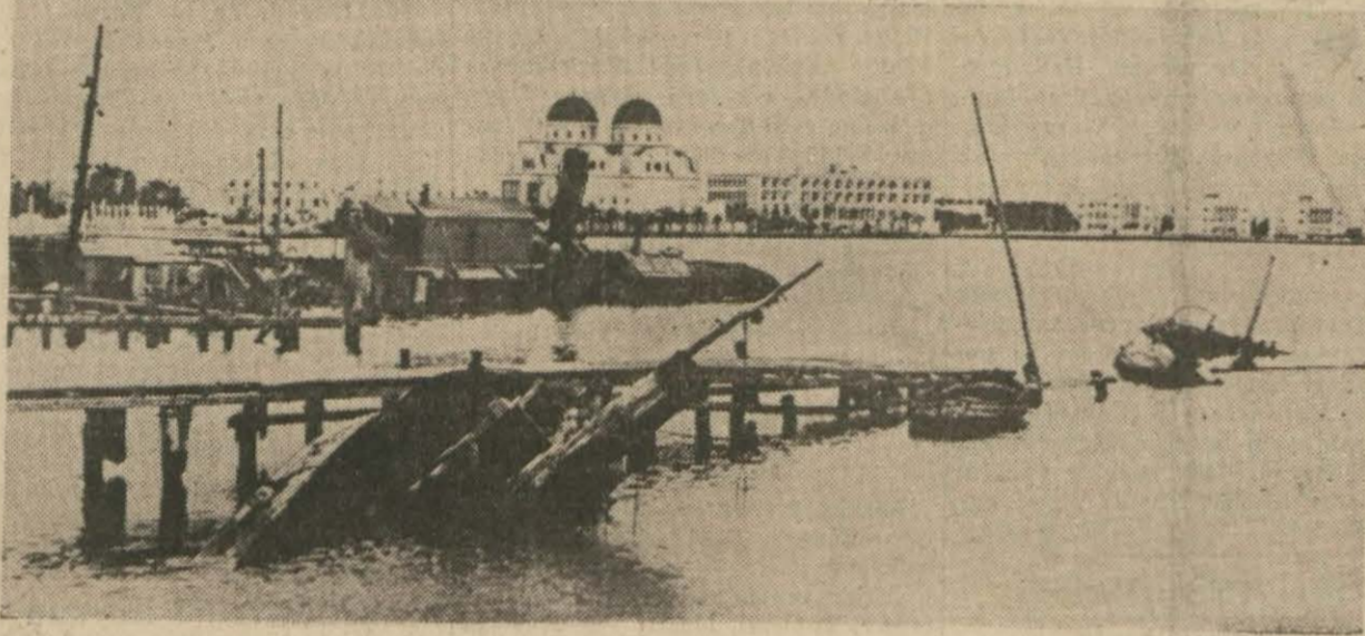
Bingazi limanında hava hücumları neticesinde batırılan İtalyan gemileri

Buna mukabil şimdiye kadar yalnız harbedenlere malzeme yetiştirmek için bir levazım ambarı halinde çalışan Amerikanın bir taraftan harekete geçmek için de hazırlanmakta bulunduğu görülüyor. General Mac Arthur'un Avustralyaya getirilerek Pasifik müdafaasına memur edilmesi, Amerikan Generali oradaki kumandanlarla görüşmekten sonra Vaşingtonda Pasifik harp konseyinin toplanması, Amerikanın Pasifikte hazırlanmakta olduğu taarruz hareketiyle alâkadar görünmektedir.