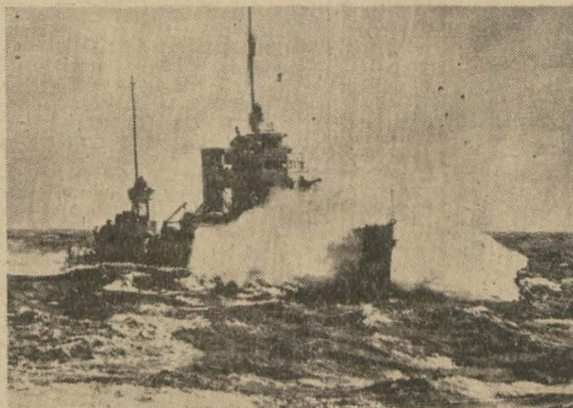
Atlantikte devriye gezen bir Amerikan harp gemisi

Dün geceden itibaren yaz saatinin tatbikine başlanmıştır ve gece 24 de saatler Türkiyenin her tarafında bir saat ileri alınmıştır.