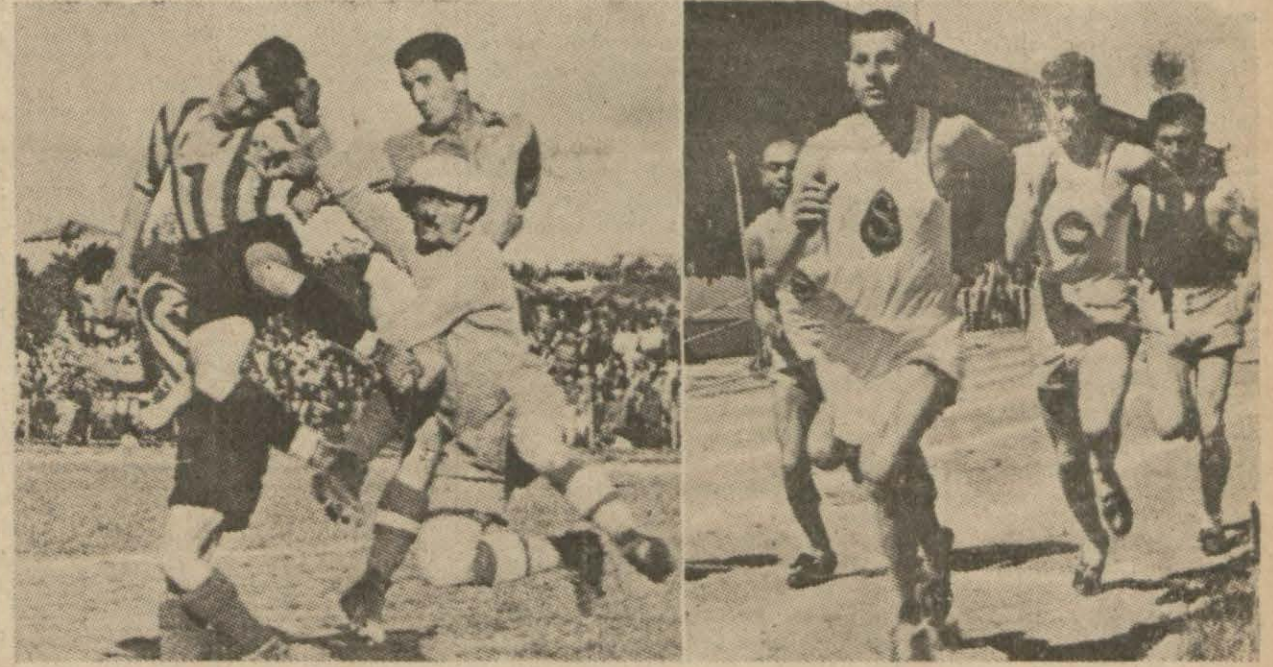
Dünkü maçtan ve atletizm müsabakalarından birer görünüş (Yazısı ikinci sayfamızdadır.)

Futbolde Fenerbahçe 3 - 1 Yenildi - Atletizmde 11 Müsabakanın Yedisini Fener, Dördünü Galatasaray Kazandı