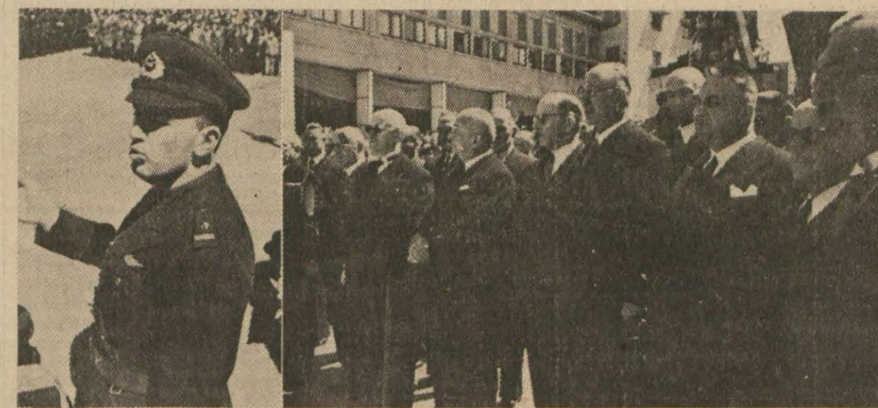
Kırk kanatlar günü münasebetiyle Ankarada yapılan ihtifalden bir iki görünüş: Bir genç hava subayı nutuk söylüyor. Meclis reisi, Başvekil ve Vekiller merasimde

Bulgaristanda da gıda madde- leri darlığı olduğu bildiriliyor.