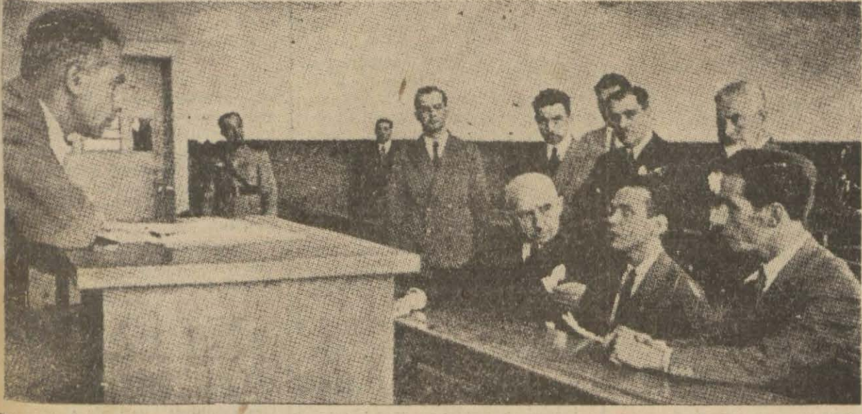
Cumhurbaşkimizin, evvelki gün Siyasal Bilgiler Okulunu şereflendirerek imtihanlarda hazır bulduklarını yazdı. Bu resimde, Millî Şefimizi, imtihan esnasında sorulan suallere talebinin cevaplarını dinlerken görüyoruz.