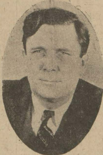
Mr. W. Willkie

Vaşington, 21 (Amerikan Enformasyon Ofisi bildiriyor) — Cümhuriyeti Roosevelt, bugün, Wandel Willkie'nin Yakınşarka yapacağı seyahatte Türkiyeyi resmen ziyaret edeceğini bildirmiştir. Verilen tamamlamaya mâni mâtâ göre, Willkie Mısır, Arabistan, Filistin ve Suriyeye uğradıktan sonra Ankara'ya giderek, Türkiye Cümhuriyetine M. Roosevelt'in şahsî bir mesajını taktim edecektir.