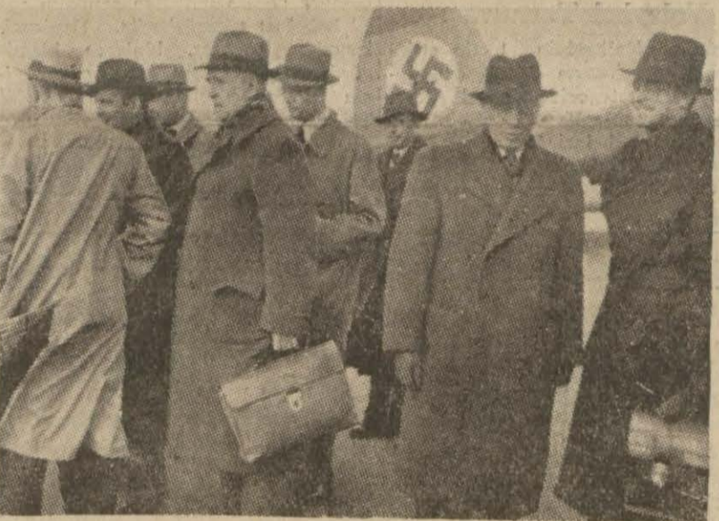
Heyet üyesi Yeşilköy hava meydanında tayyareden inerken