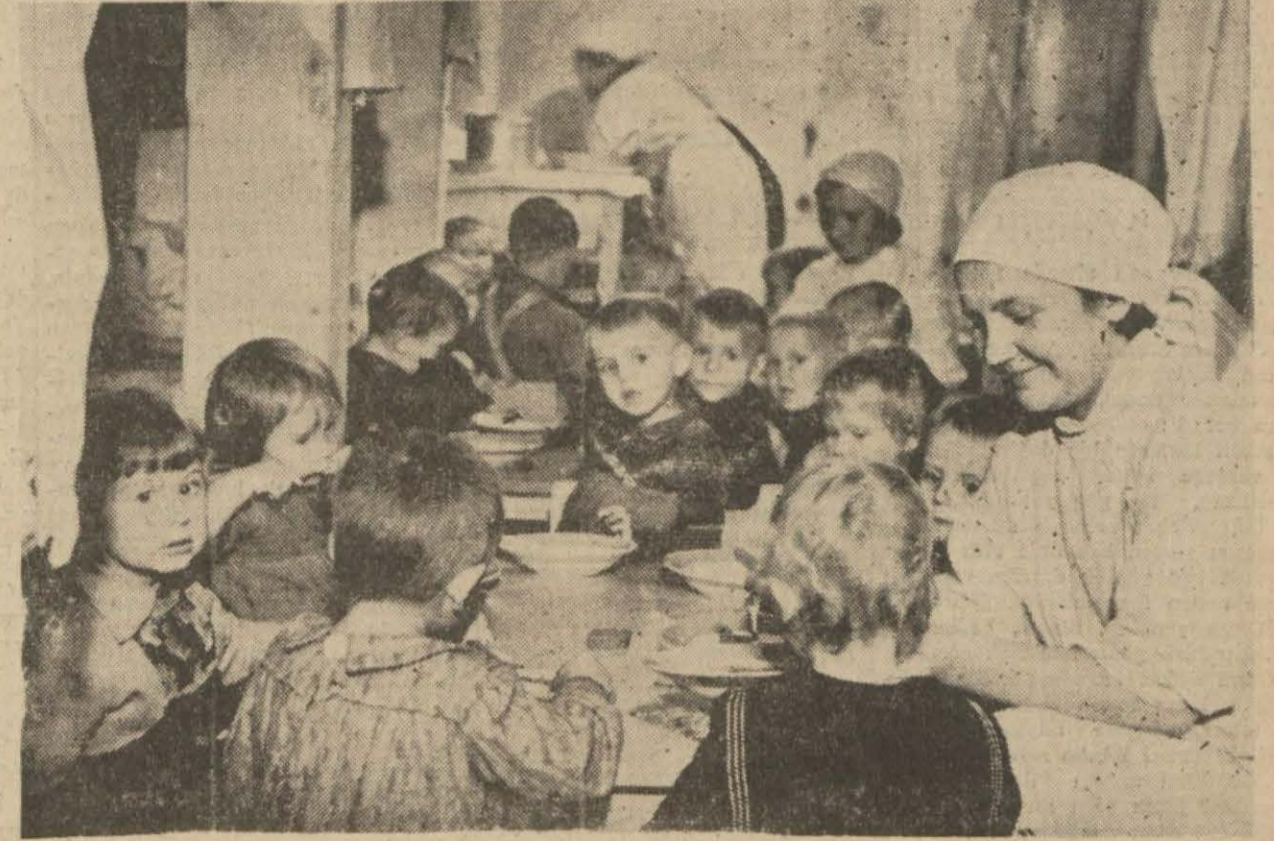
Civarında şiddetli muharebelerin cereyan ettiği Leningratta, çocuklar, bir bomba sığınagında

Belgrat'ta çıkan Obnova gazetesi, bir çok rehinelere kitle halinde tevkiif edildiğini kaydetmekte ve gönüllüleri tahrikât ve cebir hareketlerinden vazgeçmeğe davet eden bir beyanname neşretmektedir. Aynı gazete, "bugün Sırbistanda dahilî harp hücumu sürüyor," demektedir.