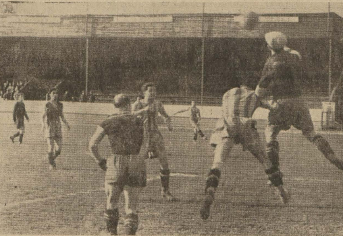
Galatasaray - Beyoğlu maçından bir enstantane (Günün spor haberlerini ikinci sayfamızda bulacaksınız)