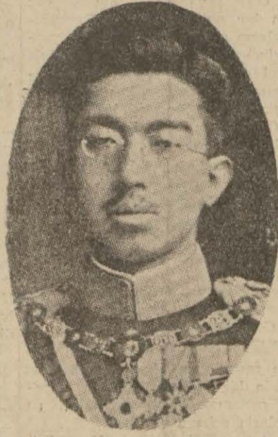
Diyet meclisinin içtimalı ziyaset eden Japon İmparatoru Hiro Hito

Tokyo, Pasifik'teki Menfaatleriyle Meşgul Olmak Kararında