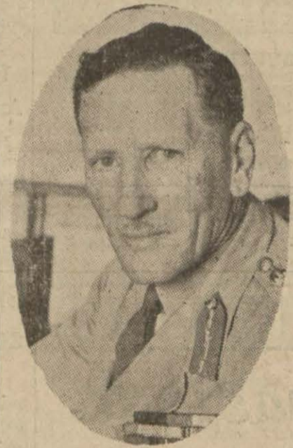
Orta Şarkta İngiliz kuvvetleri Baskumandanı General Buchinleck

Garp Çölünde Yeni Bir İngiliz Ordusu Teşkil Edildi