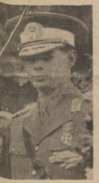
Romanya Kralı Mihai

Romanyada Umumi Seferberlik İlân Edildiği Hakkında Bir Şayia Dolanıyor