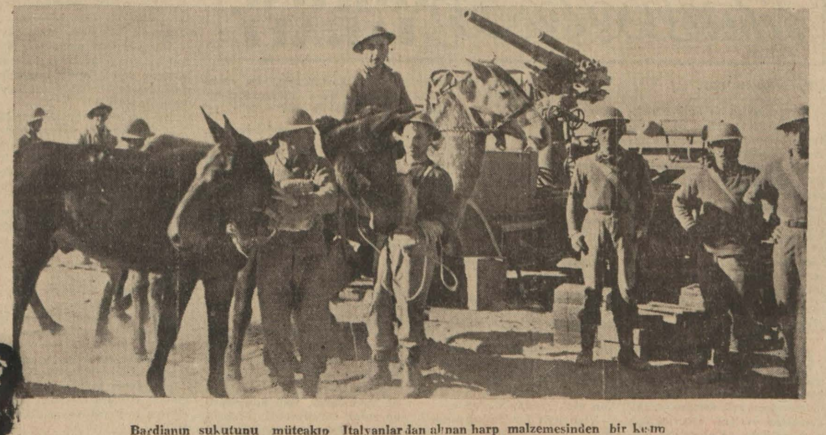
Bardianın sukutunu müteakip İtalyanlar Jan alnan harp malzemesinden bir kurt

Vaşington, 15 (A.A.) — Mümesiller Meclisinin Hariciye Encümeni demokrasilere yardım kanun projesi hakkında bugün ilk olarak Hariciye Nazırı Hull'ü dinlemiştir. Hull ezümle demiştir ki: "Pasifikte yapılması tasarlanan sözde yeni nizam, diğer milletlerin menfaatleri hiçe sayılarak bir tek memleketin tahakkümü demektir. Bu kadar çok (Sonu: Sa 5; Sü 5)