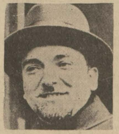
Son şayialar dolayısıyla ismi geçen Grandi

İtalyanın Sulh Talebinde Bulunması İhtimalleri Artıyor