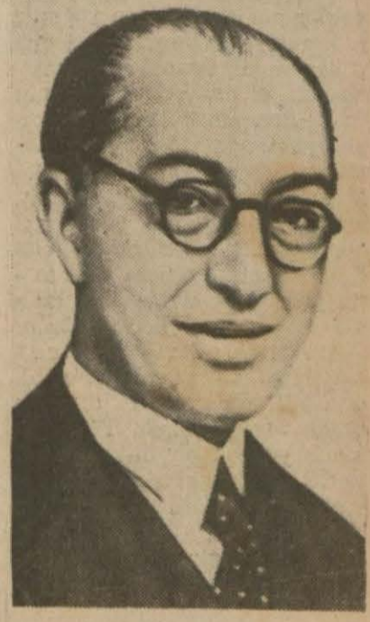
Tefvik Rüşti Aras