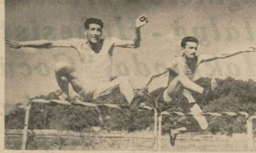
Dünkü atletizm grup birinciliklerinden bir enstantane

Müsabakalar Sonunda İstanbul Birinci, Bursa İkinci, Kocaeli Üçüncü ve Kırklareli Dördüncü Oldu